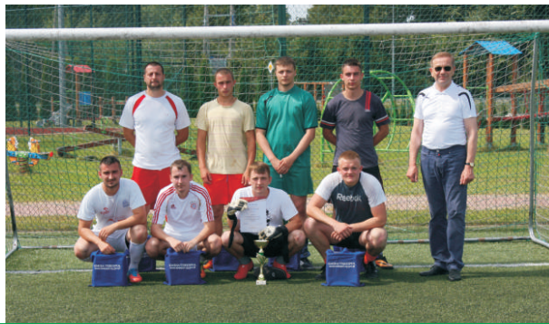
I MIEJSCE ZAJĘŁA DRUŻYNA Z MAŁASZEWICZ