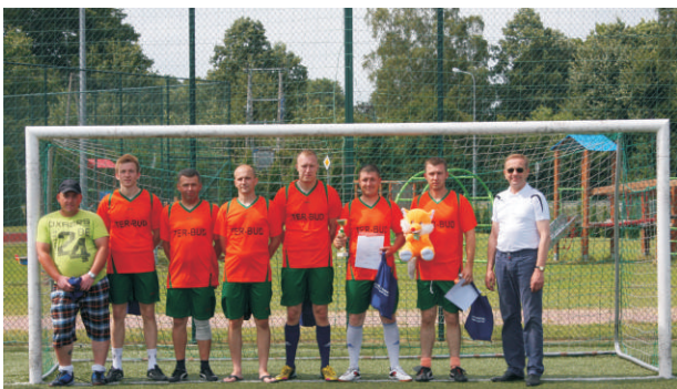
II MIEJSCE ZAJĘŁA DRUŻYNA Z KOROSZCZYNA