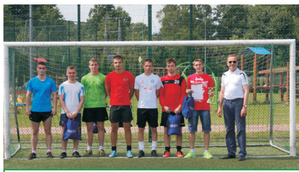
III MIEJSCE ZAJĘŁA DRUŻYNA Z TERESPOLA - AMARENA