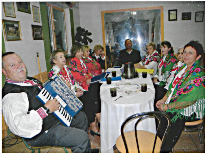
W odnowionym klubie w Sworach tętni piosenka i muzyka

świetlicy. Całość została ogrodzona, wstawiona