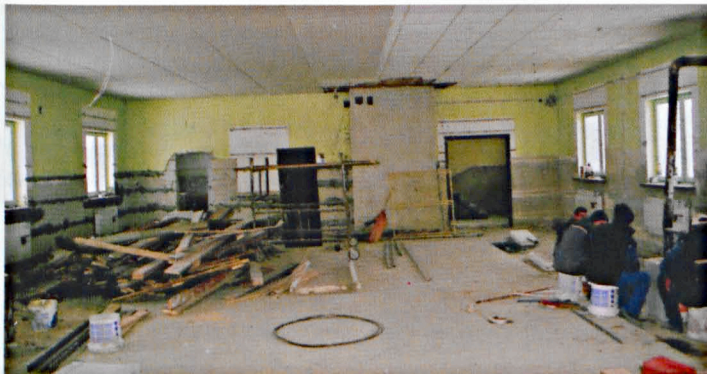
Remont pomieszczeń klubu kultury w Hrudzie

Również pod koniec 2010 r. oddano uroczystie do użytku rozbudowany i zmodernizowany klub kultury w Sworach. Zadania