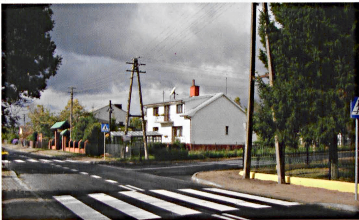
Na budowę priorytetowej drogi w Sławacinku Starym gmina wydała prawie 4,5 mln zł

Urząd Gminy Biała Podlaska solidnie wywiązał się z przyjętego zobowiązania. W rok po oddaniu do użytku pierwszego etapu drogi gminnej w Sławacinku Starym uruchomiony został drugi odcinek drogi, łączący sołectwo