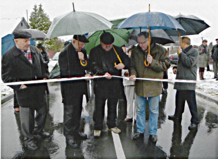
W strugach deszczu otwierano drugi etap budowy drogi w Sławacinku Starym

- Choć dzieło miało kilku wykonawców, najważniejszym będzie zadowolenie ludzi z Rakowisk, którzy wreszcie będą mogli poruszać się wygodnie - dodaje wójt.