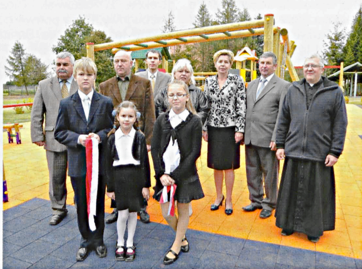
Pierwszy w gminie plac zabaw otrzymała szkoła w Sworach

W następnym roku Szkoła Podstawowa i Publiczne Gimnazjum w Sworach