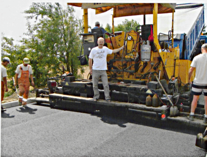
Trwa budowa ostatniego etapu drogi w Sławacinku Starym

Przy okazji otwarcia drogi ogłoszono ukończenie budowy oświetlenia ulicznego w Rakowiskach. Na ten cel przeznaczono aż 700 tys. zł. W uroczystości otwarcia trasy i przekazania jej do eksploatacji uczestniczyli oprócz władz gminnych: wicemarszałek województwa lubelskiego Sławomir Sosnowski , starosta Tadeusz Łazowski , zaproszeni goście, inspektorzy nadzoru i wykonawcy drogi. Jak stwierdził Andrzej Mizerny , budowa drogi w Rakowiskach możliwa była dzięki dobrej współpracy samorządu z mieszkańcami wsi, którzy wyrazili zgodę na nieodpłatne przekazanie części własnych gruntów, aby