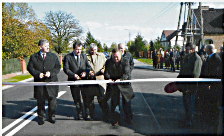
Utwardzona droga w Rakowiskach zgromadziła nie tylko gości

Budowa drogi możliwa była dzięki dotacji unijnej. Pokryła ona połowę kosztów inwestycji. Rok wcześniej oddany został pierwszy etap (ponad 1 km), od ul. Budziszewskiej do sklepu spożywczego w centrum miejscowości. W tym roku dokończono budowę ul. Wspólnej od sklepu do lasu na końcu