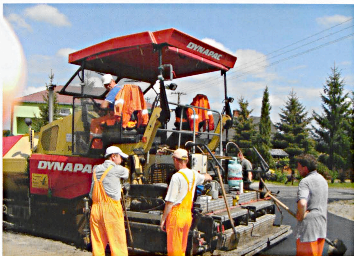
W ciągu trzech lat nowe nawierzchnie otrzymało 13 sołectw