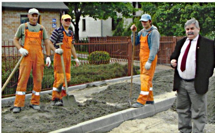
Wójt gminy interesuje się żywo budową dróg