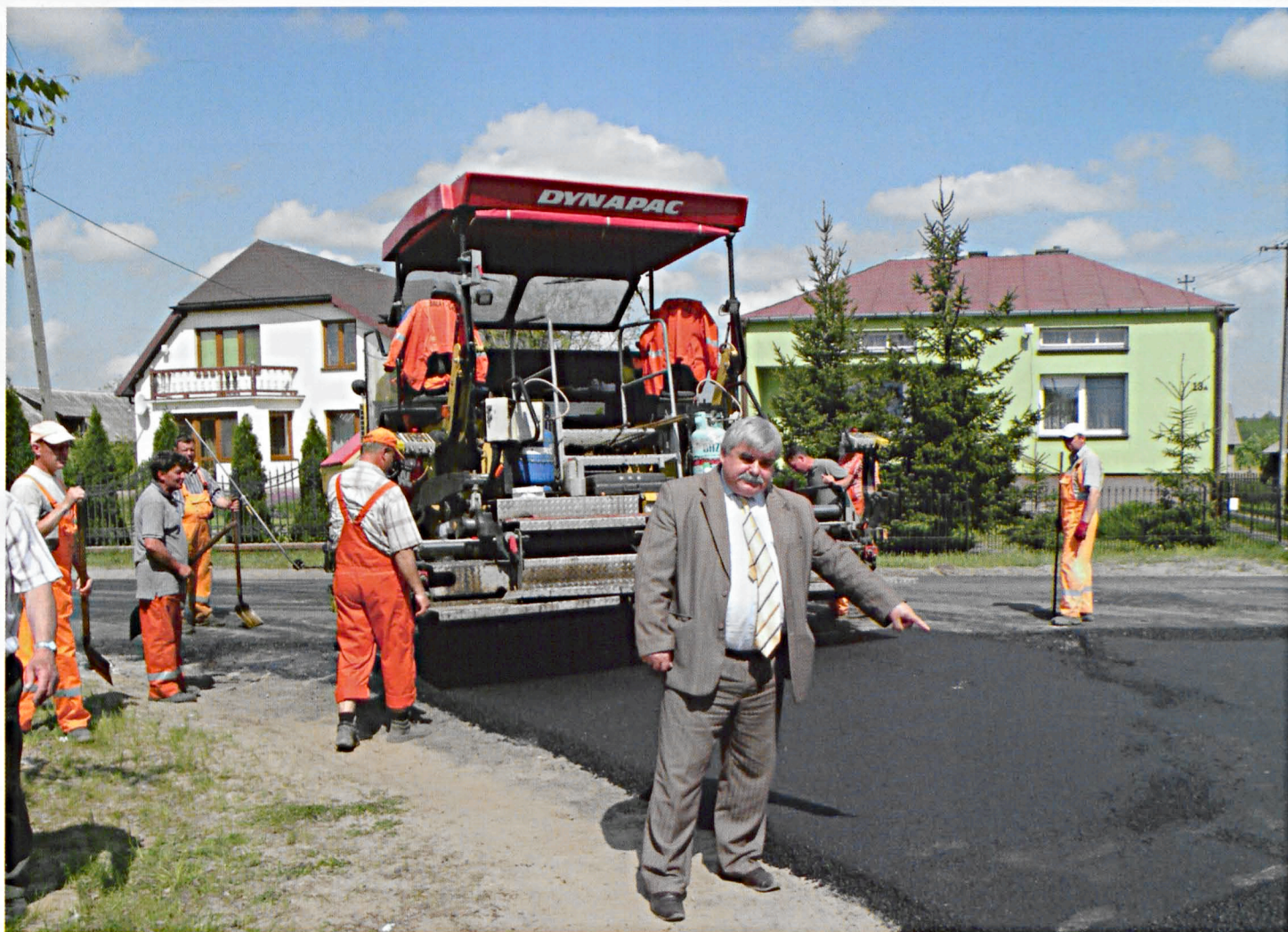
Wójt nadzorował remont nawierzchni drogi w Czosnówce

Usługi Projektowe M. Kobylińskiej podjęła się za 15 tys. zł opracowania projektu odwodnienia środkowej części drogi w Sławacinku Starym (330 m.). Reasumując, w ciągu