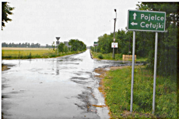
Droga ze Swór do Pojelec