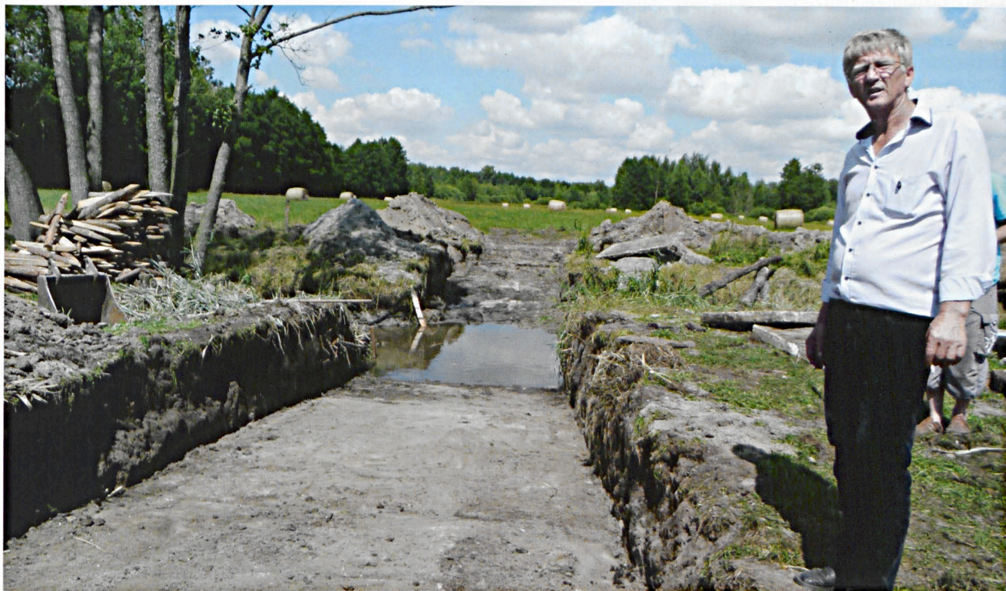
Budowa brodu na Rudce w Janówce

Sprawne, utwardzone drogi cieszą wszędzie tam, gdzie się je buduje. Nikt nie zaprzeczy, że bezpieczne drogi to także solidnie oświetlone. Gmina wydaje na ten cel niemałe fundusze. Dokonuje też niezbędnych remontów i napraw. Tylko w tym roku przeznaczono 21 tys. zł na remont i dobudowę oświetlenia drogowego w Porosiukach. Wykonała go ku zadowoleniu