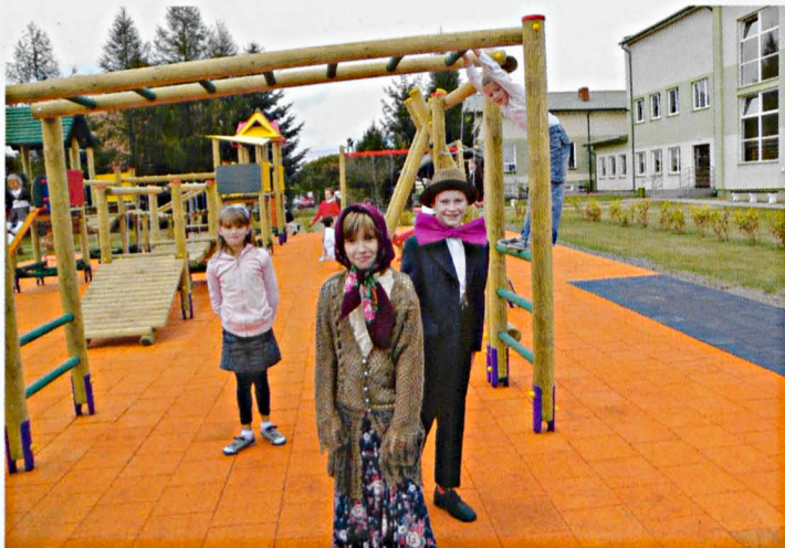
Dzieci chętnie się tu bawią