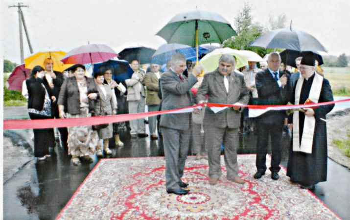
Ta droga ucieszyła bardzo mieszkańców Pojelec