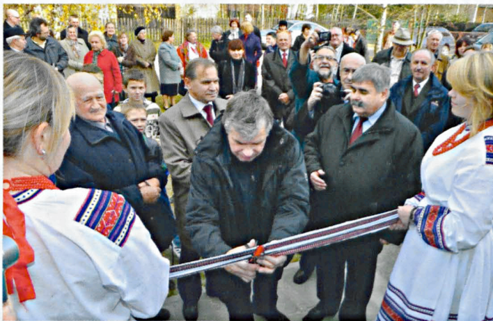
Otwarcie zmodernizowanej pracowni tkackiej w Hrudzie

W ostatnich latach odnowiliśmy już dziesięć świetlic wiejskich i każda z nich jest wizytówką miejscowości oraz centrum życia kulturalnego. Jestem przekonany, że odnowiona pracownia ściągać będzie wielu ludzi, nie tylko z naszej gminy, bo tkaczki z tej miejscowości zdołały pokazać się z dobrej