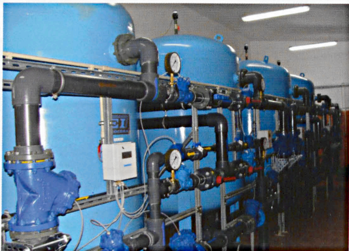
Nowe urządzenia gwarantują bezawaryjną pracę stacji

Rok 2011 zapisał się w historii gminy również innymi zadaniami wodociągowo-kanalizacyjnymi. Pracownicy Przedsiębiorstwa Wielobranżowego Budomex wykonali 2 km 156 metrów kanalizacji sanitarnej w Ciciborze Dużym. Zadanie kosztowało 784 tys. zł, a mieszkańcy uwolnili się niczym za dotknięciem czarodziejskiej różdżki od kłopotów z opróżnianiem szamb przydomowych. Teraz ścieki z Cicibora Dużego popłynęły do oczyszczalni w Białej Podlaskiej przy ul. Brzegowej. Ta sama firma zbudowała 8, 6 km sieci kanalizacji sanitarnej w Czoznówce. Na to zadanie gmina musiała wyłożyć 1 mln 772 tys. zł. Tam, gdzie budowa