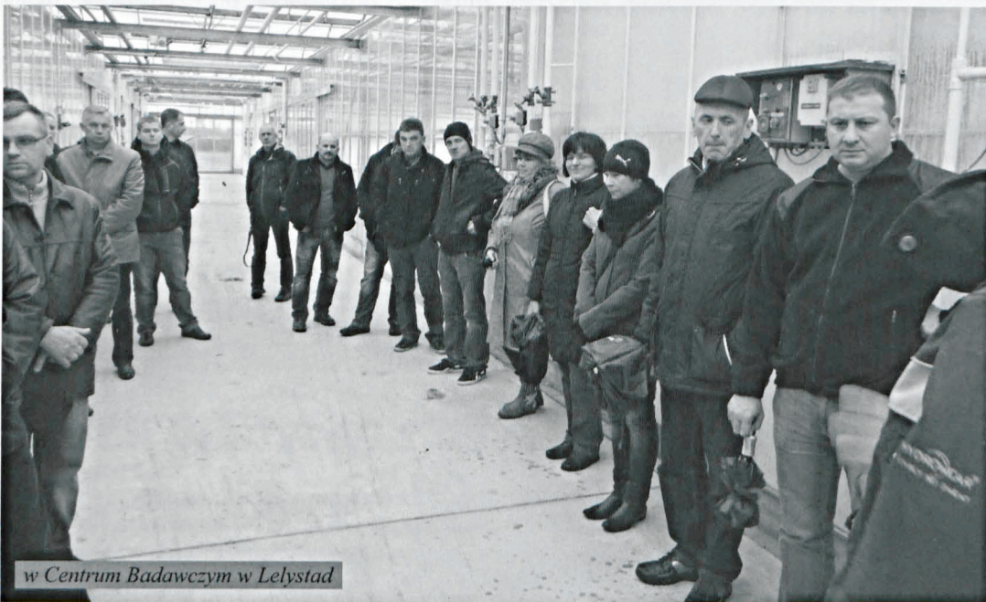
w Centrum Badawczym w Lelystad

W Praktijkonderzoek Plant en Omgeving - Centrum