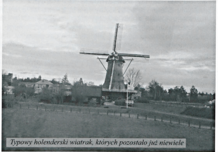
Typowy holenderski wiatrak, których pozostało już niewiele

zarówno konwencjonalnych, jak i prowadzonych metodami ekologicznymi.