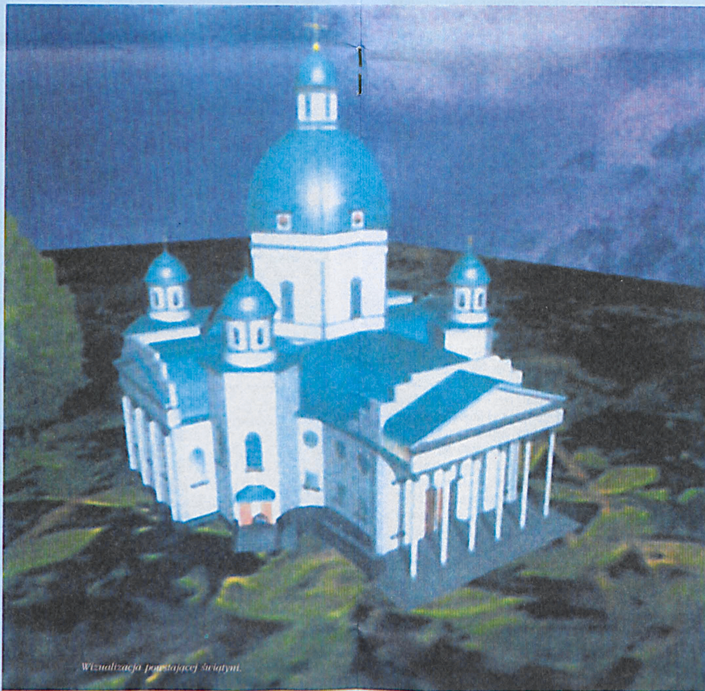
Wizualizacja powstającej świątyni.