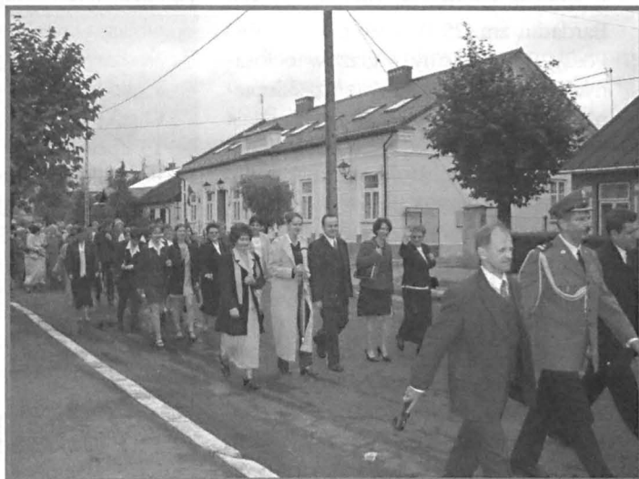
Przemarsz gości i pracowników BS z Bazyliki do siedziby banku