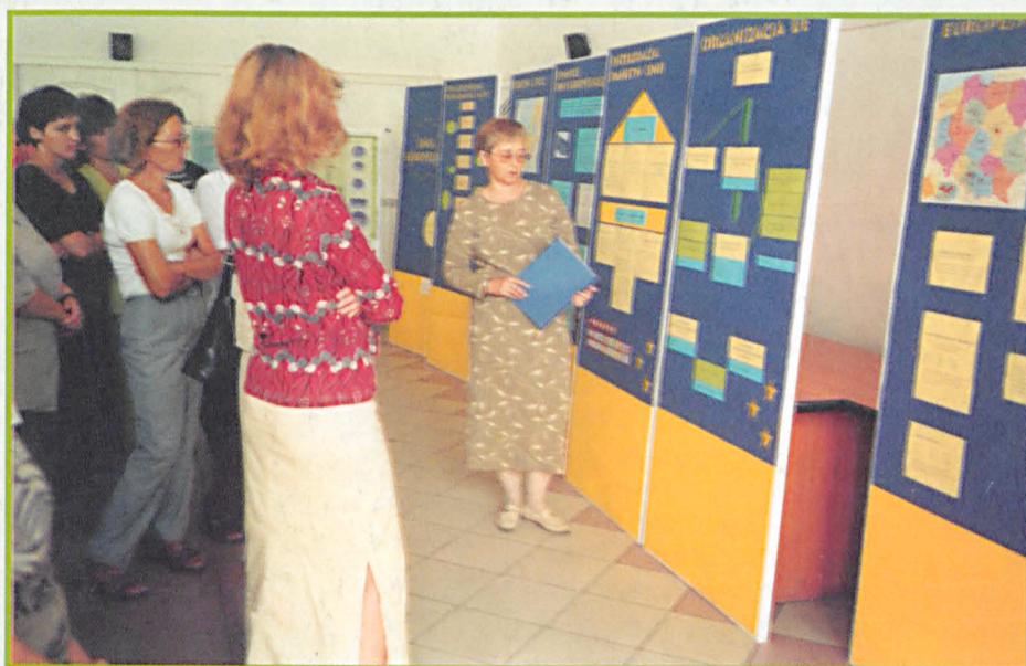
Wystawa „Unia Europejska”