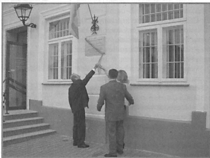
Odsłonięcie tablicy na froncie siedziby banku upamiętniającej jubileusz 100-lecia

Goście i pracownicy przed siedzibą banku