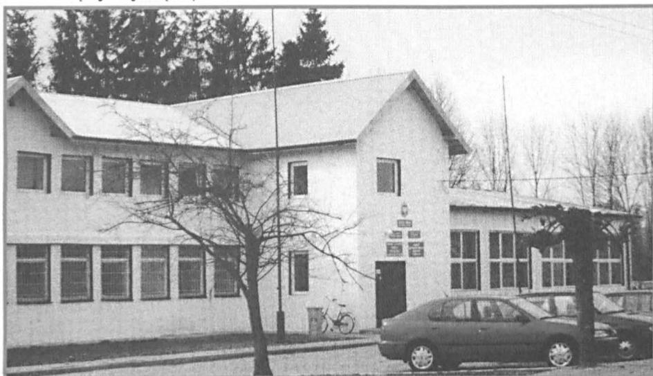
Siedziba samorządu gminnego w Dębowej Kłodzie