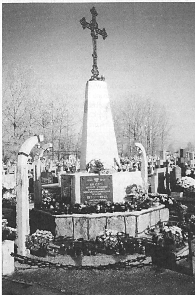
Pomnik ku czci mieszkańców miasta – ofiar II wojny światowej na parczewskim cmentarzu