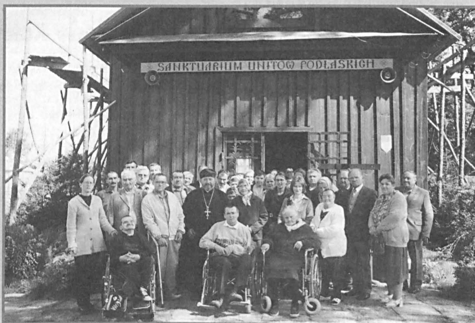
Przed spotkaniem integracyjnym w DSP Kostomłoty mieszkańcy i pracownicy DSP w Kalince uczestniczyli wraz z gospodarzami w nabożeństwie w cerkwi unickiej.

Obecnie w domu zamieszkuje 35 osób (41% ogółu mieszkańców) z powiatu parczewskiego, w tym 12 z terenu miasta i gminy Parczew.