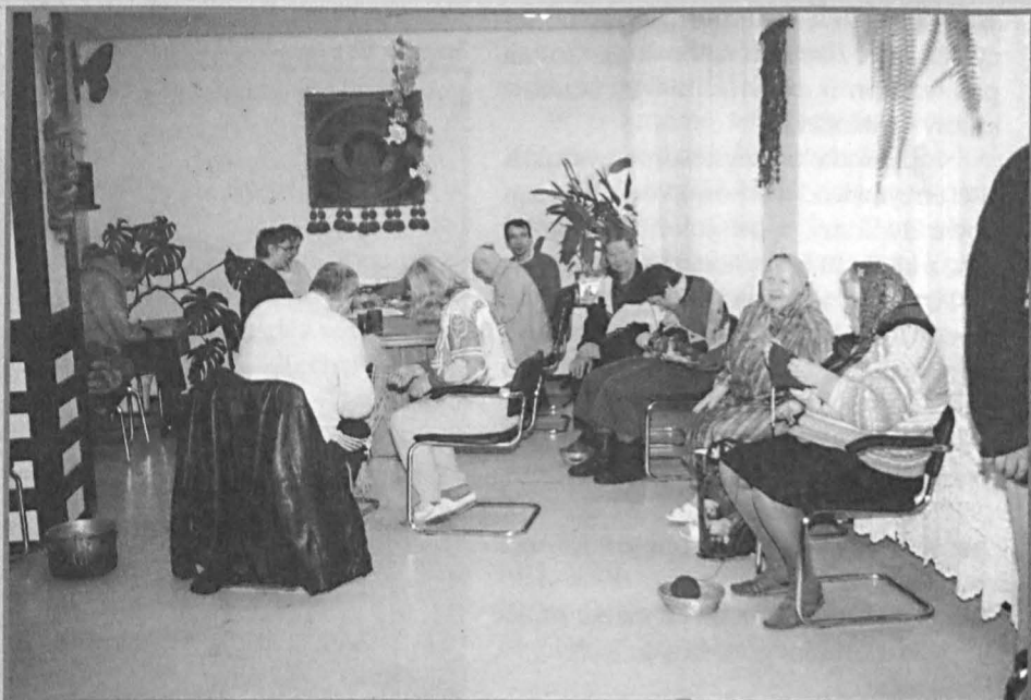
Mieszkańcy DSP w Kalince w trakcie terapii zajęciowej.