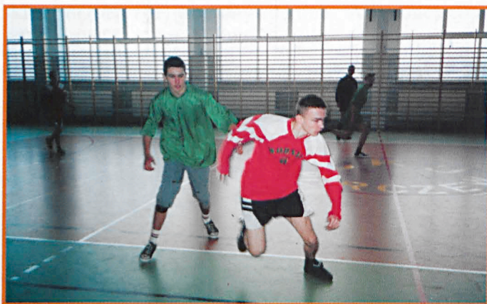
Drużyna LZS Działyni – zwycięzca Gminnego Turnieju Halowej Piłki Nożnej w Siemieniu.

Trzy pierwsze drużyny zostały nagrodzone pucharami, a pozostałe dyplomami. Dwa najlepsze zespoły reprezentować będą nasz powiat w eliminacjach rejonowych w miesiącu styczniu. J.N.