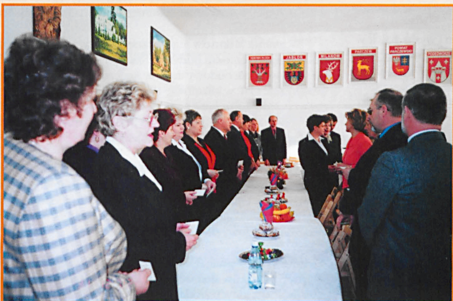
Spotkanie opłatkowe w Starostwie Powiatowym.