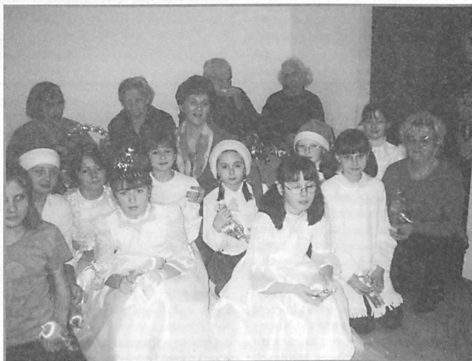
Dzieci kl. III i IV Szkoły Podstawowej w Siemieniu w Domu Opieki Społecznej w Tulnikach.