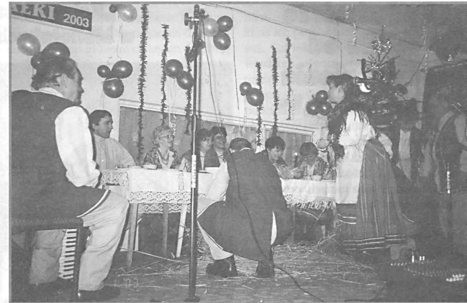
„Wrzeciono” z Podedwórza zaprezentowało „Wieczere wigilijną”.