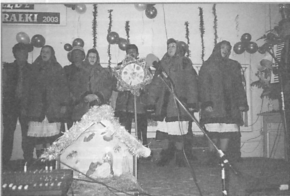
„Jarzębina” z Paszenek przyniosła ze sobą szopkę i gwiazdę.