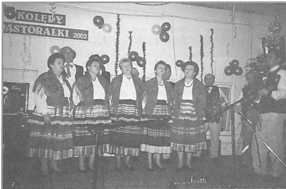
Na scenie zespół „Kalina” z Jabłonia.