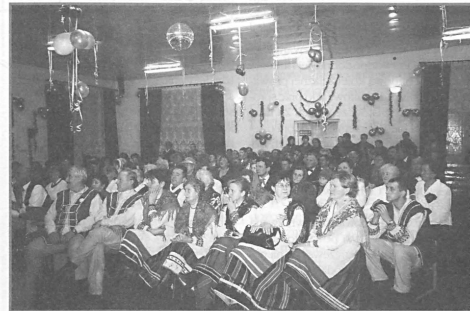
Sala Gminnego Ośrodka Kultury w Dębowej Kłodzie „pękala” w szwach.