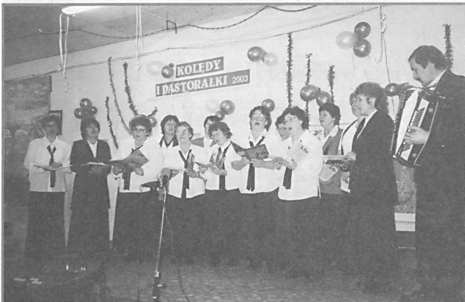
„Hetmanki” z Sosnowicy śpiewały z ogromnym zaangażowaniem.