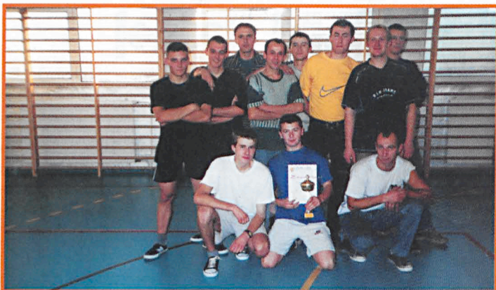
Drużyna LZS Działyni – zwycięzca Gminnego Turnieju Halowej Piłki Nożnej w Siemieniu.

Rada Gminna Zrzeszenia LZS w Siemieniu przeprowadziła w ostatnim czasie kilka imprez sportowych dla miejscowych LZS-ów. I tak w zawodach rekreacyjno-sportowych, na które składały się konkurencje: rzut lotką do tarczy, rzut piłką do kosza, strzał piłką do bramki, strzał do piłki, slalom piłkarski i strzelanie z wiatrówki, wzięło udział 5 zespołów. Zwyciężył LZS Działyni – 62 pkt, przed LZS Miłków – 55 pkt i LZS Jezioro – 51 pkt. Zwycięska drużyna otrzymała Puchar Rady Gminnej LZS.