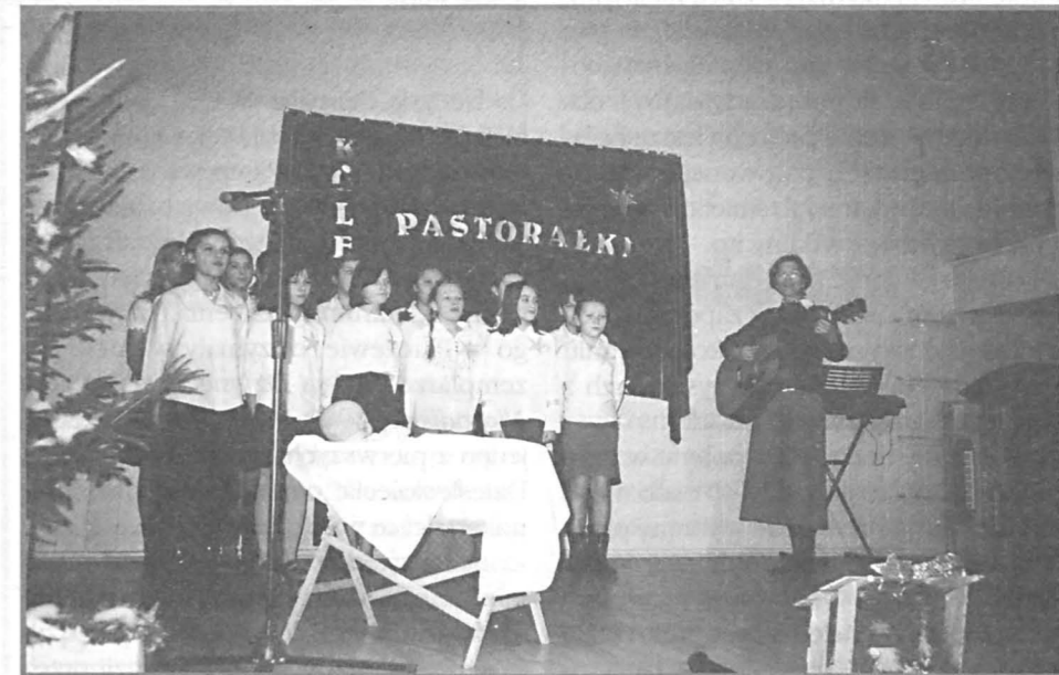
Zespół „Schola” z Milanowa śpiewał przy Jezusiczku w kołysce.