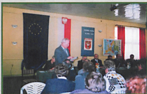
Spotkanie w Dębowej Kłodzie.