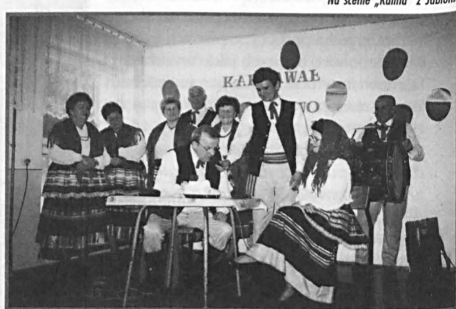
Na scenie „Kalina” z Jabłonia

Zespół swoimi występami uświetnił w minionym roku wiele imprez powiatowych: Przegląd kolęd i pastorałek „Hej kolęda, kolęda” w Paszenkach, Oplatek Ludowy w Parczewie i koncert kolęd w Milanowie. Wystąpił podczas „Majówki” w Sosnowicy i pleneru w Jabłoni. Z inscenizacją „Z gwiazdą i turokiem” zaprezentował się na Powiatowym Przeglądzie Teatrów Wiejskich w Paszenkach i otrzymał nominację do przeglądu międzywojewódzkiego w Stoczku Łukowskim. Ponadto brał udział w Festiwalu Kultury Polskiej na Litwie, a 30 listopada uświetnił imprezę dla dzieci niepełnosprawnych pow. parczewskiego „Andrzejki – integracja wokół tradycji”.