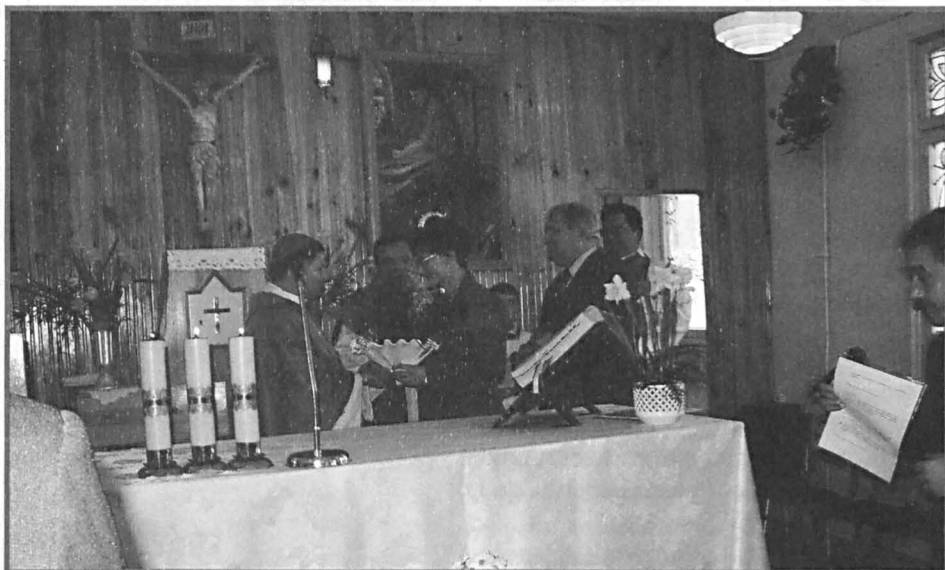
Powitanie księdza biskupa