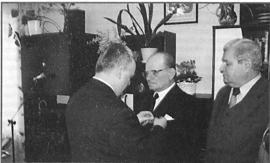
Dekoracji dokonuje wojewoda lubelski