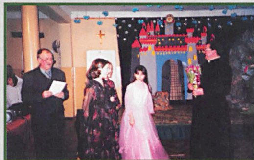
Spotkanie integracyjne w Miłkowie