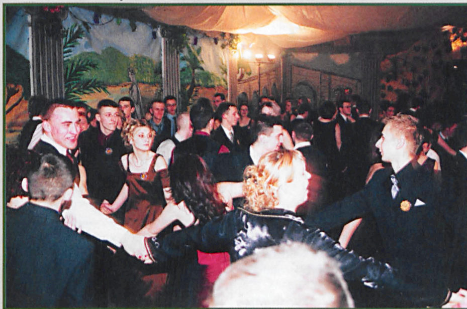
i w Centrum Kształcenia Ustawicznego w Parczewie.