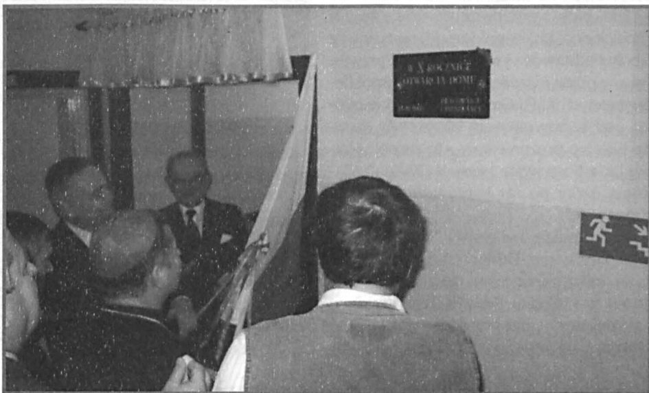
Odślonięcie tablicy pamiątkowej