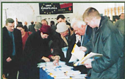
Stoisko z materiałami informacyjnymi o Unii Europejskiej cieszyło się dużym powodzeniem.