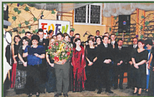
Przed rozpoczęciem balu w CKU Parczew