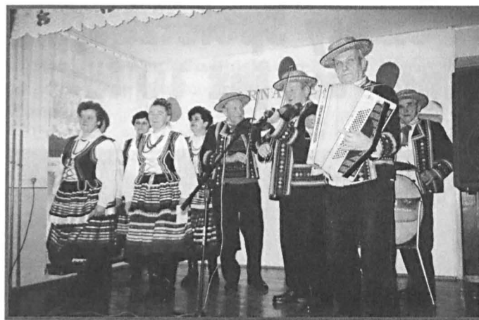
Zespół „Siedliszczanie” z Siedliszcza k. Chełma

15 lutego w Szkole Podstawowej w Podędwórze zorganizowano już po raz trzeci „Karnawał na ludowo”. Gospodarzami imprezy było Stowarzyszenie na Rzecz Aktywizacji Mieszkańców Polesia Lubelskiego i zespół ludowy „Wrzeciono”.