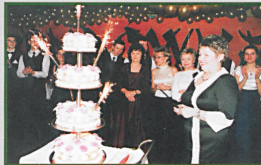
Atrakcją balu w LO im. Kopernika w Parczewie był imponujący tort.