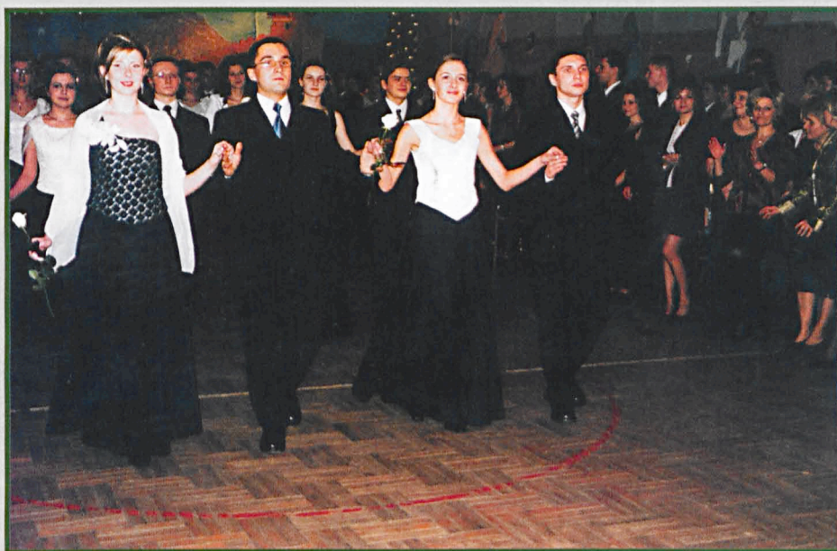
W Liceum Ogólnokształcącym im. M. Kopernika w Parczewie