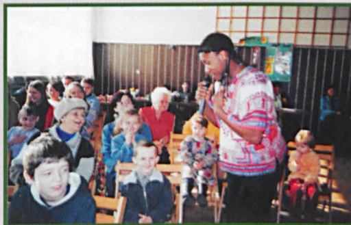
„Brzechwa Afryka Show” cieszył się ogromnym powodzeniem