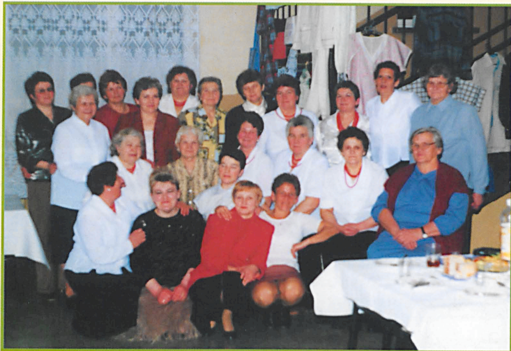
Portret rodzinny członkiń KGW w Kolonii Miłków.