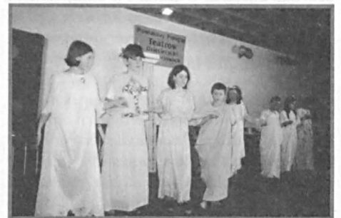
Na scenie uczniowie Zespołu Szkół Publicznych w Sosnowicy.

3 kwietnia br. w Powiatowej Bibliotece Publicznej – Centrum Kultury w Parczewie odbyły się eliminacje powiatowe XLVIII Ogólnopolskiego Konkursu Recytatorskiego, który w bieżącym roku dedykowano Konstantemu Ildefonsowi Gałczyńskiemu (50 rocznica śmierci poety). Konkurs jest adresowany do młodzieży, studentów i dorosłych, którzy chcą i potrafią twórczo obcować z literaturą poprzez jej piękne i mądre mówienie.