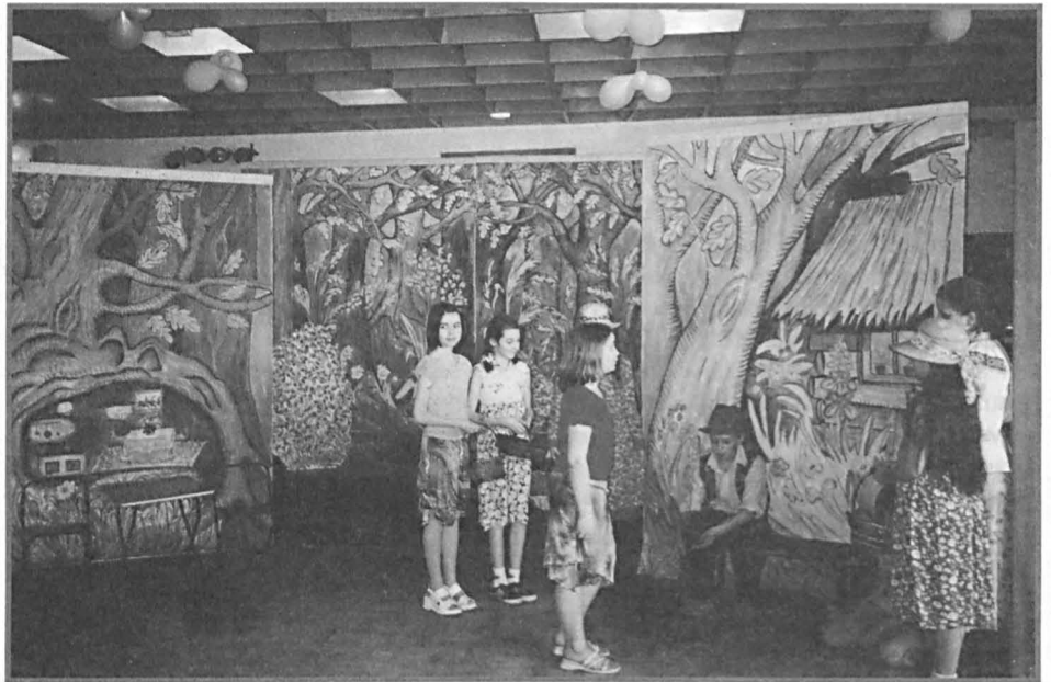
Prezentuje się zespół parczewskiego Domu Kultury.

22 marca 2003 r. w Woli Osowińskiej (pow. radzyński) odbył się czwarty Konkurs Recytatorski Poezji i Prozy Ludowej im. Wacława Tuwalskiego. Wśród 103 uczestników z całego województwa lubelskiego było sześcioro reprezentantów