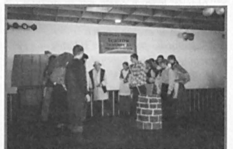
Spektakl Gimnazjum w Podedwórze.