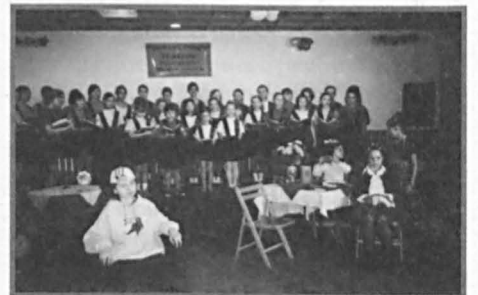
Prezentacja Szkoły Podstawowej nr 2 w Parczewie.