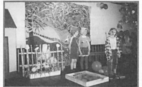
Występują maluchy ze Szkoły Podstawowej w Jabloniu.