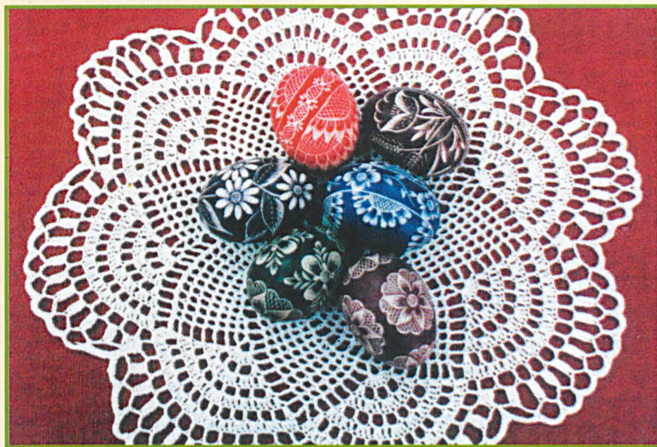
Pisanki z kiermaszu PDK

Zdrowych i wesolych Świąt Wielkanocnych życzy Czytelnikom redakcja „Ziemi Parczewskiej”