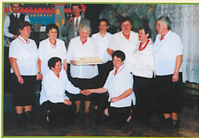
Wspaniały tort osłodził obchody jubileuszu.