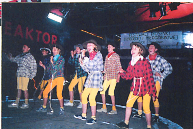
Powiatowy Przegląd Piosenki Dziecięcej i Młodzieżowej w Parczewie