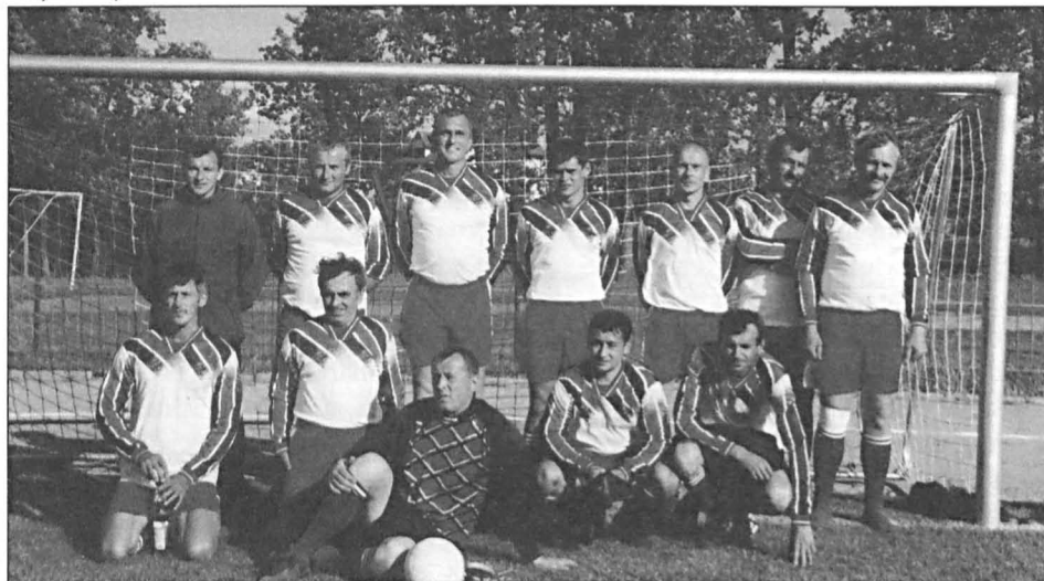
Drużyna oldboyów LKS Milanów

„Orleń” Radzyń Podlaski 3:1, „Orzeł” Łosice 5:3 policja Biała Podlaska 2:1 i ponosząc tylko jedną porażkę z „Pogonią” Siedlce, zajmują III miejsce, za drużynami z Międzyrzecza Podlaskiego i Siedlec, otrzymał pamiątkowy dyplom i Puchar Dyrektora Ośrodka Terapeutycznego w Doldze.