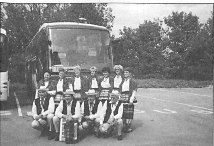
Zespół Ludowy „Kalina” z Jabłonia przed wyjazdem na festiwal.