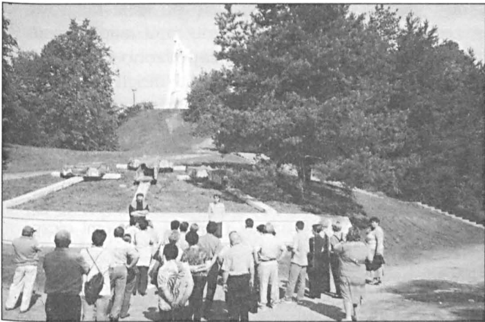
Uczestnicy u stóp Góry Trzech Krzyży w Wilnie