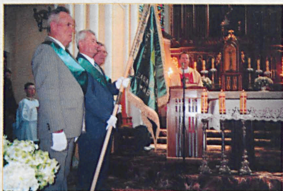
Poświęcenie sztandaru w kościele w Jabłoniu