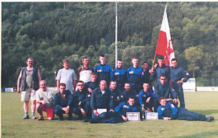
Drużyny OSP Milanów w Luxemburgu