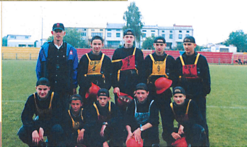
Młodzieżowa Drużyna Pożarnicza chłopców z Milanowa