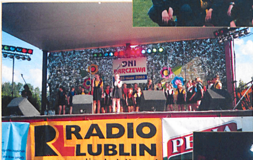
Dni Parczewa jak co roku wypadły bardzo okazale. Nz. fragment imprezy na stadionie miejskim.