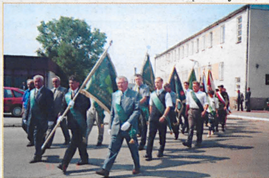
Przemarsz uczestników Święta Ludowego na stadion