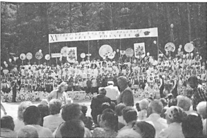
Amfiteatr festiwalu „Kwiaty Polskie” w Niemenczynie k/Wilna