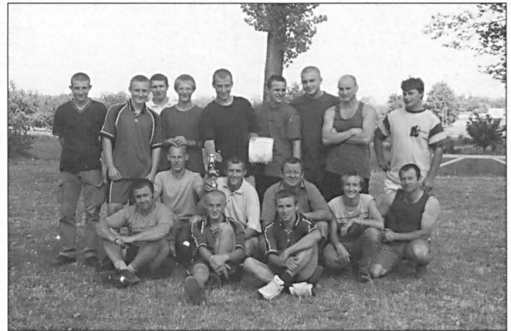
Zawodnicy ULKS „Komar” z Podedwórza na turnieju w Siemieniu