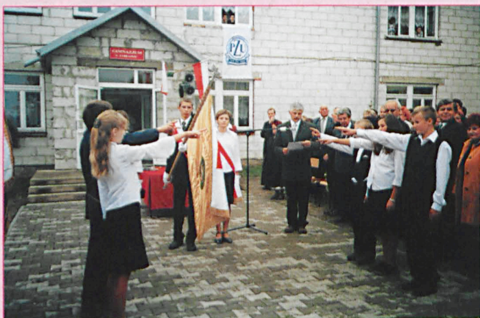
Gimnazjum im. W. Witosa w Jabłoni otrzymało 5 października sztandar. Nz. moment ślubowania uczniów na nowy sztandar.