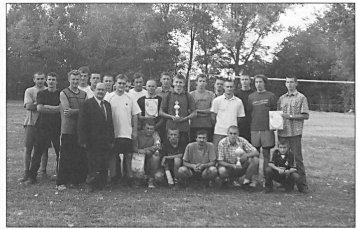
Uczestnicy turnieju piłki siatkowej w Milkowie