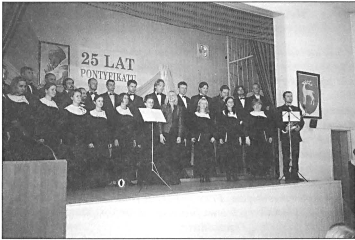
Koncert Chóru UMCS