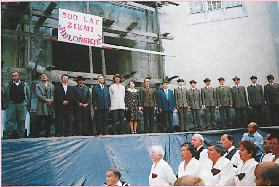
Widowisko plenerowe „Gościna w Jabloniu” przed pałacem Zamoykich...