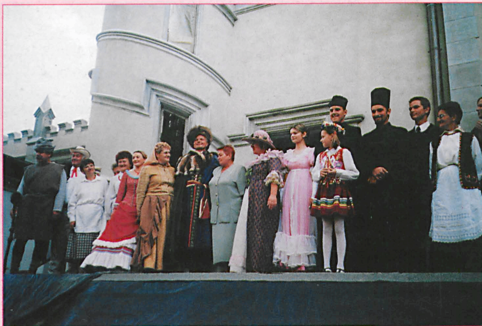
Nz górnym i z boku – fragmenty imprezy plenerowej „Gościna w Jabłoniu”