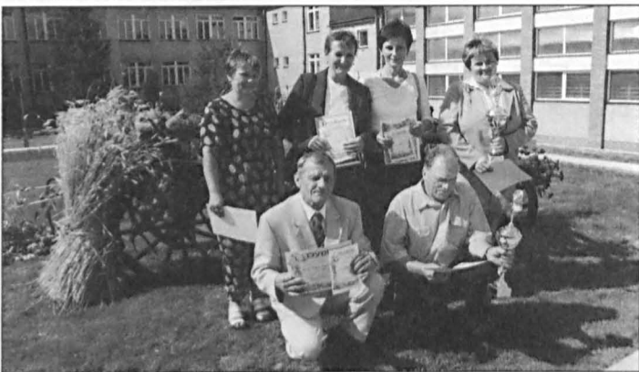
Uczestnicy gminnego konkursu na „Chłopa i Kobiety Gminy Siemień 2003”