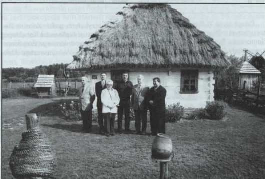
W pensjonacie „Uroczyisko Zaborek”