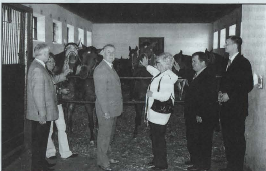
W jawnowskiej stadninie

Na zakończenie uroczystości starosta oraz przewodniczący delegacji wymienili adresy pamiątkowe.