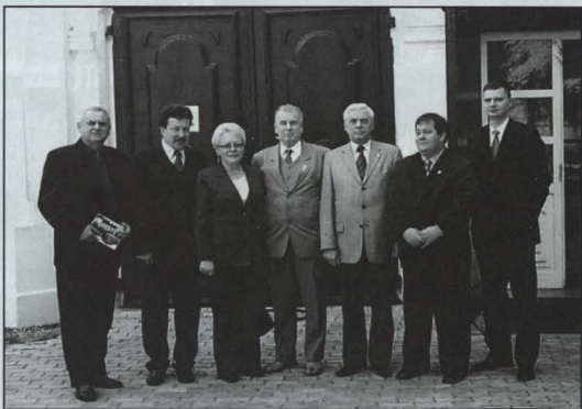
W ośrodku OHP w Roskoszy