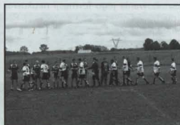
Zwycięzcę turnieju (w białych koszulkach) przed jednym z meczów