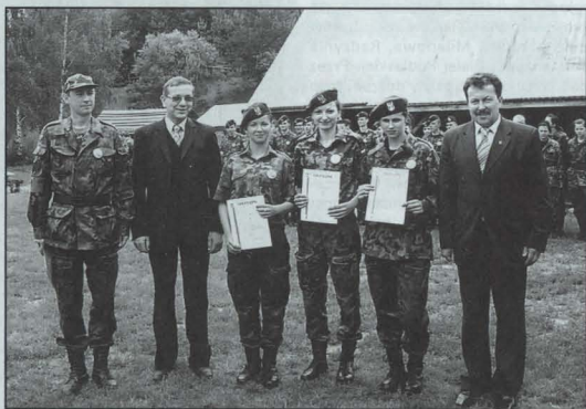
Reprezentacja młodzieży z Małaszewicz