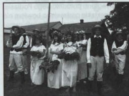
Zespół Czeladońka wystąpił z widowiskiem sobotkowym

trzech grup ludowych: miejscowej Czeladońki, Zielawy z Rossosa oraz formacji śpiewaczej z Bokinki Pańskiej. Widowisko sobotkowe wsparte pieśniami ludowymi z Podlasia ogromnie po-