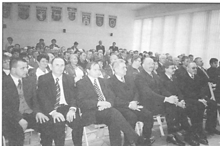
Uczestnicy opłatka ludowego