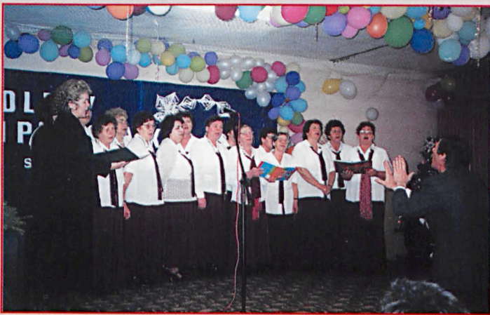
Zespół „Hetmanki” z Sosnowicy