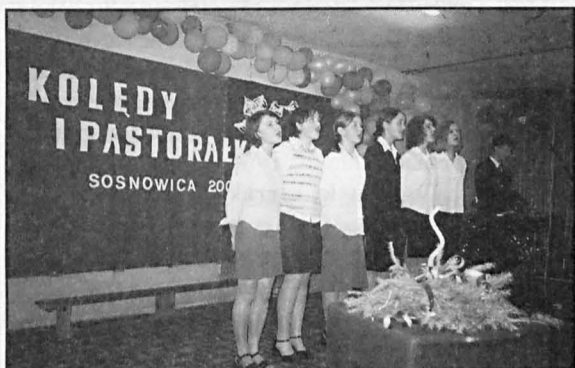
Młodzież z ZSP w Sosnowicy