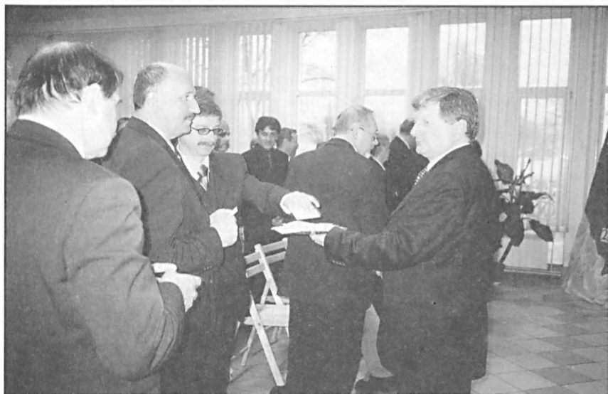
Łamanie się opłatkiem