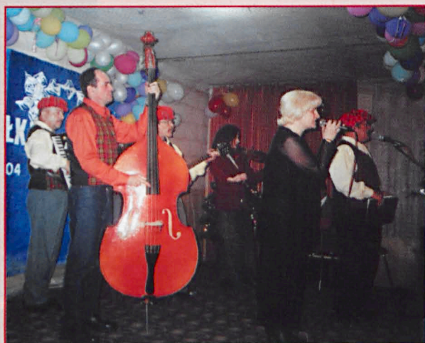
Parczewska Kapela Podwórkowa „Taka Paka”