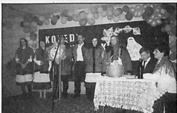
Zespół „Jarzębina” z Paszenek (gm. Jabłoń)