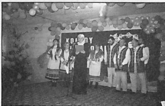
Zespół „Wrzeciono” z Podedwórze podczas występu