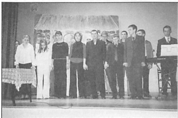
Grupa młodzieży z LO w Parczewie po występie