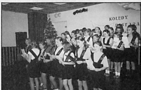
Zespół „Trójna na Szybach” z SP nr 1 w Parczewie na kolędach w ODK