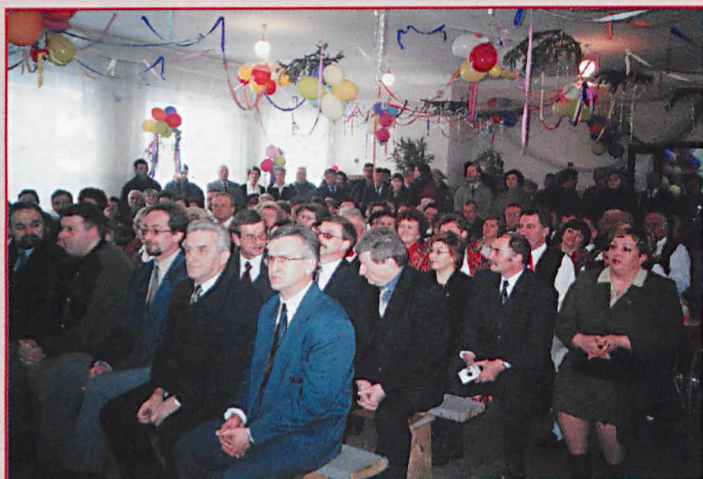
Goście przeglądu kołęd w GCK w Sosnowicy