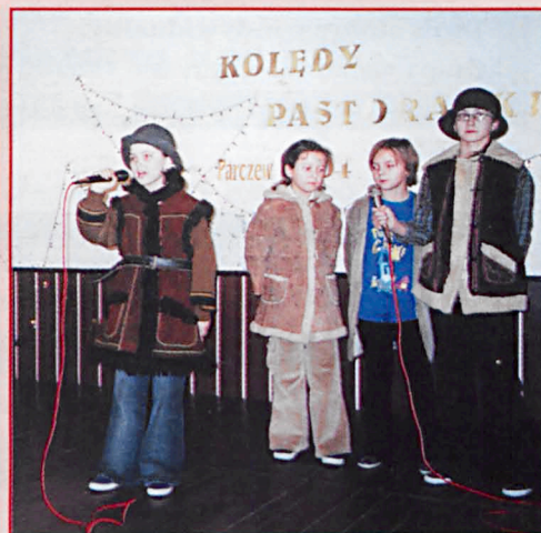
Zespół wokalny z SP w Tyśmienicy (gm. Parzew)