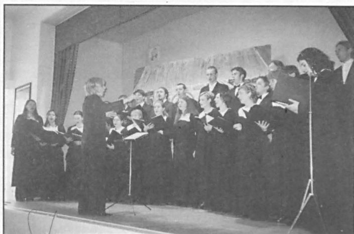
Na zakończenie spotkania wystąpił chór UMCS