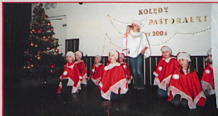
Zespół „Słoneczka” z Miłkowa