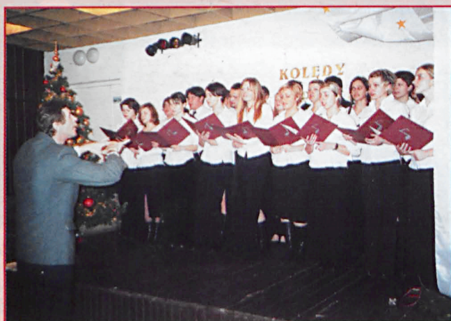
Chór przy Zespole Szkół Rolniczych w Jabloniu