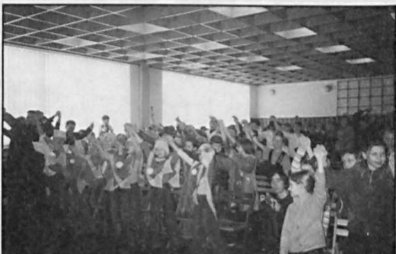
Publiczność w sali ODK w Parczewie reagowała bardzo żywiołowo