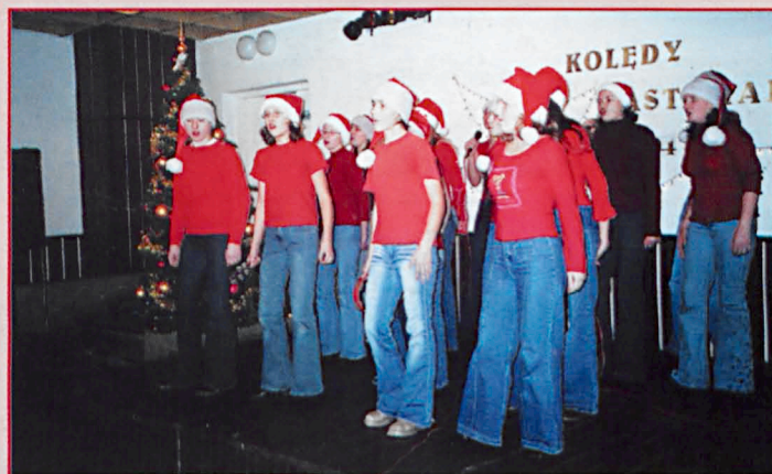
Zespół wokalny z Gimnazjum w Siemieniu