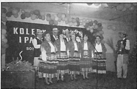
„Kalina” z Jabłonia