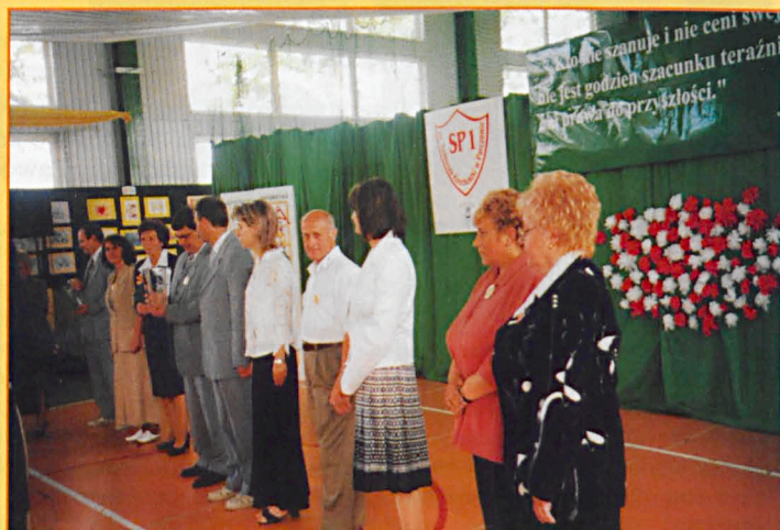
Wyróżnienia dla dyrekcji szkół