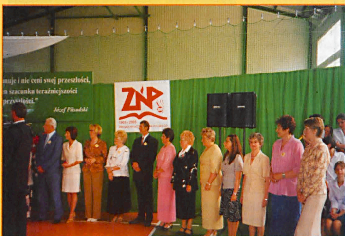
Grupa odznaczonych nauczycieli