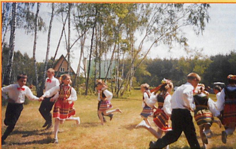
Występ zespołu z PDK w Parczewie dla dzieci niepełnosprawnych w Gęsi