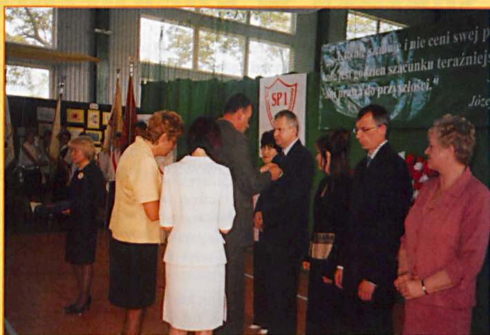
Wręczenie odznaczeń związkowych