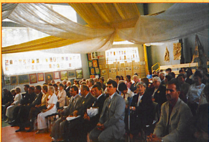
Goście uroczystości jubileuszowych