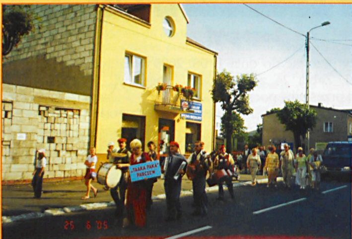
Przemarsz kapel ulicami Parczewa