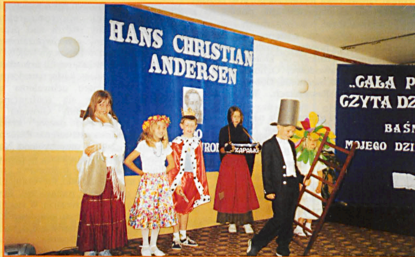
Baśnie Andersena w GBP-CK w Sosnowicy