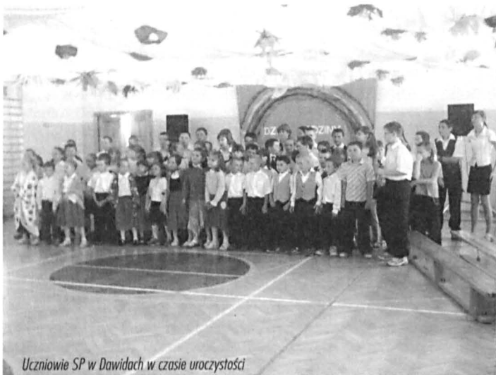
Uczniowie SP w Dawidach w czasie uroczystości