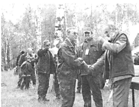
Organizatorzy mistrzostw podczas zakończenia imprezy