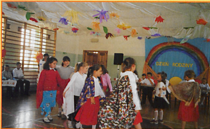
Dzień Rodziny w SP w Dawidach