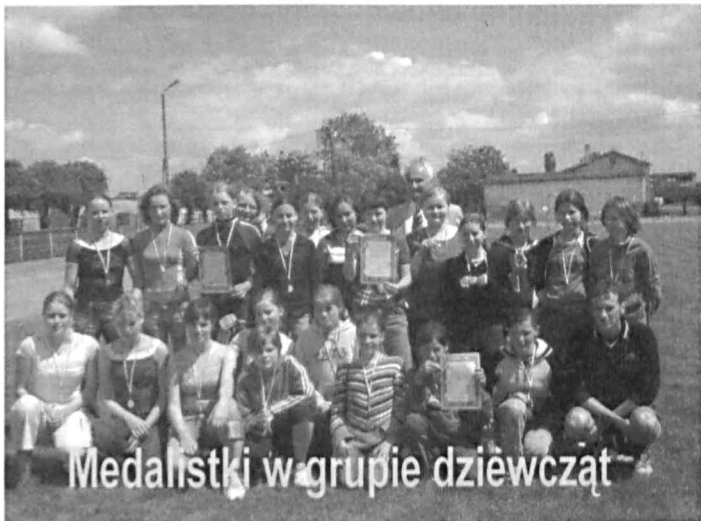
Medalistki w grupie dziewcząt

W Milanowie powrócono do bardzo trafego pomysłu sprzed kilku lat, by obchody Dnia Dziecka połączyć ze świętem sportu. Gminny Ośrodek Kultury, Ludowy Klub Sportowy oraz Szkoła Podstawowa i Gimnazjum w Milanowie pod patronatem Urzędu Gminy zorganizowały turniej piłkarski dla dzieci i młodzieży pod hasłem „Poszukujemy Talentów”. W zawodach zaprezentowała się cała plejada uzdolnionej sportowo młodzieży nie tylko z terenu gminy