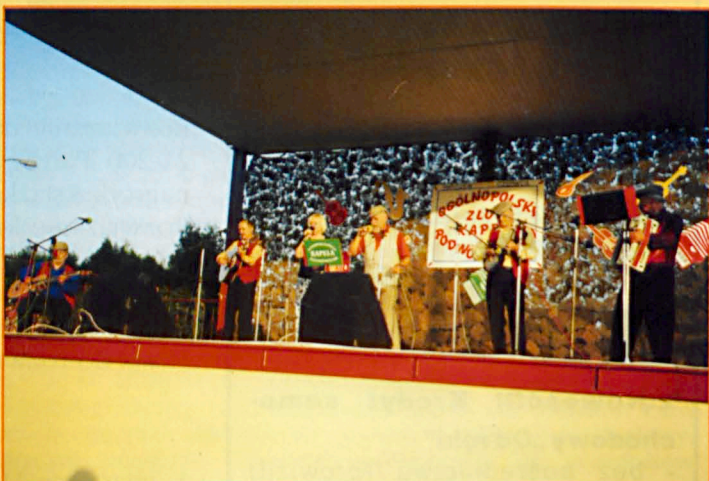
Występy kapel na estradzie