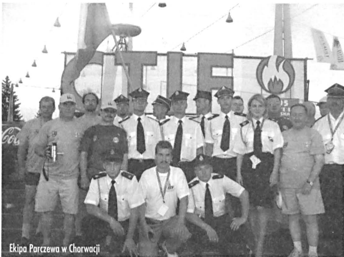
Ekipa Parczewa w Chorwacji

Opracował: kpt. Zbigniew Hawryluk – rzecznik prasowy Komendanta Powiatowego PSP w Parczewie.