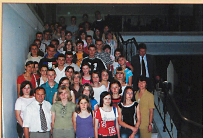
Wycieczka dzieci z Gimnazjum w Siemieniu na schodach w Sejmie