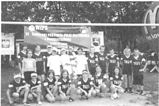
Skład całej sekcji UKS „ORION” Przewłoka