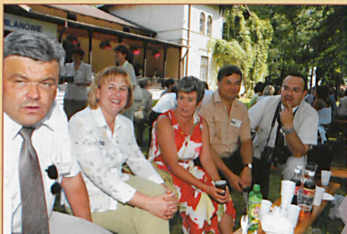
Absolwenci LO w Milanowie podczas zjazdu