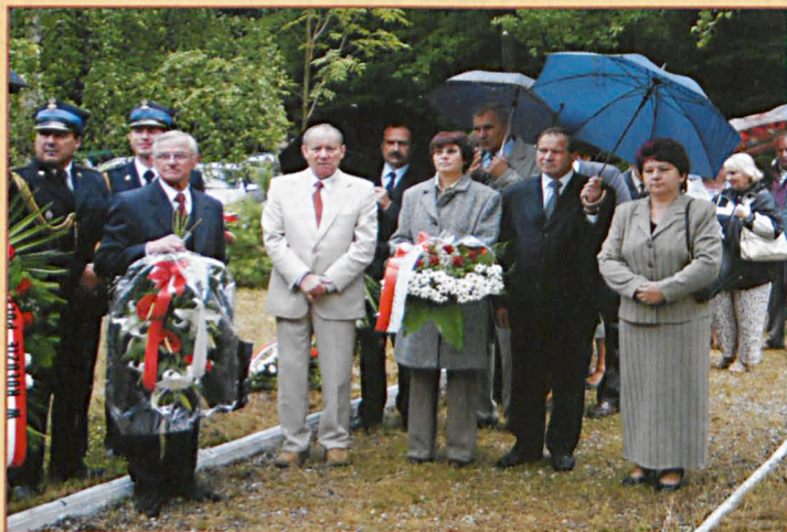
Delegację władz województwa i powiatu podczas uroczystości w Lasach Parczewskich