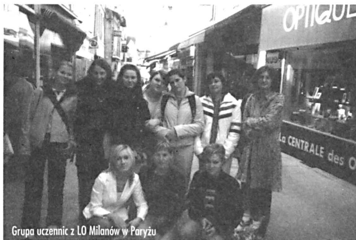
Grupa uczennic z LO Milanów w Paryżu