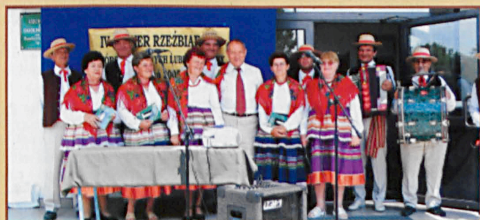
Zespół "Kalina" z Jabłonia po występie na zakończenie pleneru