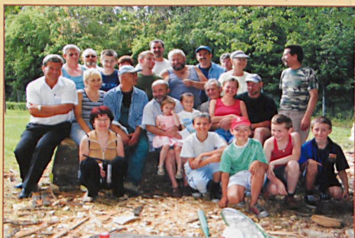
Uczestnicy IV Pleneru Rzeźbiarskiego w Jabloniu