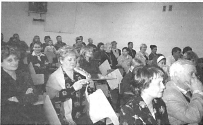
Uczestnicy uroczystości otwarcia szkoły