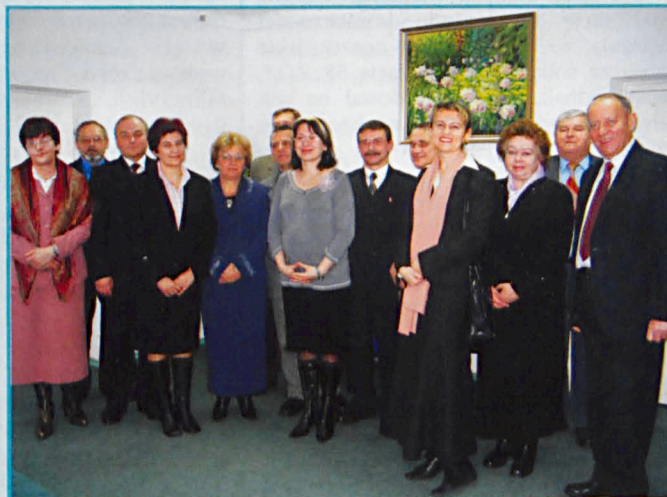
Spotkanie oplatkowe w Starostwie Powiatowym