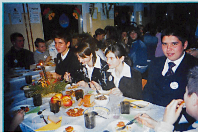
Wigilia w Zespole Placówek Oświatowych w Podedwórzcu