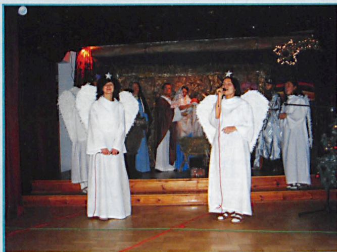
Jasełka w Medycznym Studium Zawodowym w Parczewie