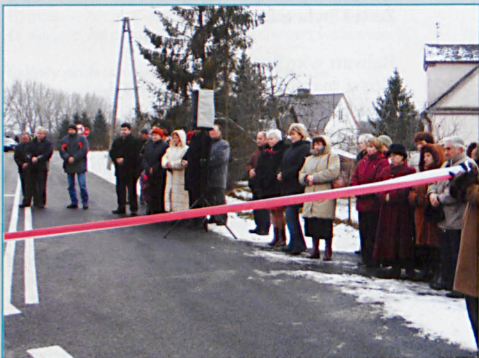
Zgromadzona ludność Sosnowicy