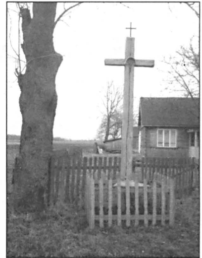
Crzyż z 1918 r. postawiony jako wotum w rocznicę odzyskania niepodległości przez Polskę.

W ogólnopolskim projekcie „Szlakiem tradycji i kultury wsi polskiej” uczestniczyło sześć gmin z województwa lubelskiego i świętokrzyskiego. Uroczyste podsumowanie nastąpiło 20 grudnia 2005 roku w Warszawie. Na zorganizowanej w