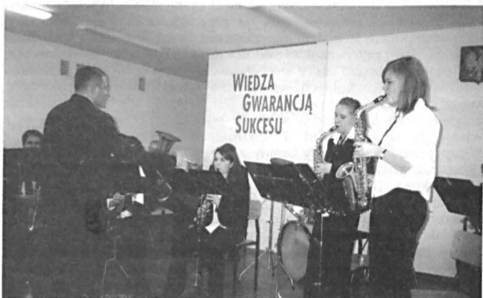
Koncert Orkiestry Dętej OSP z Milanowa