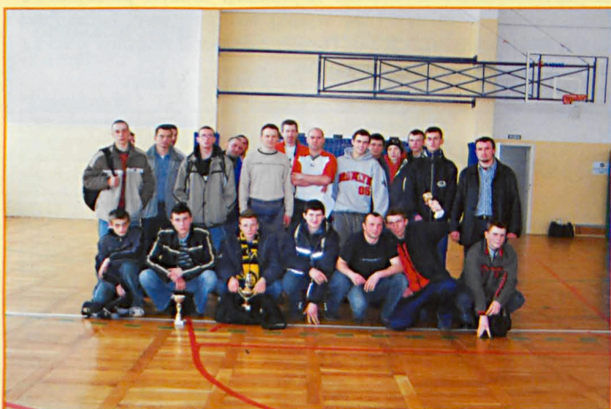
Uczestnicy turnieju halowej piłki nożnej w Siemieniu