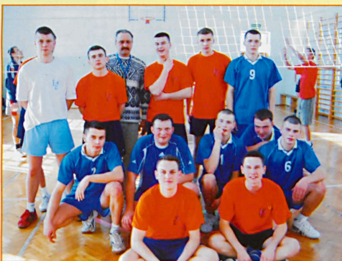
Drużyny LZS Dawidy i "Jesion" Jasionka

Fotoreportaż z turniejów sportowych w Sosnowicy, Parczewie, Siemieniu i Dawidach.