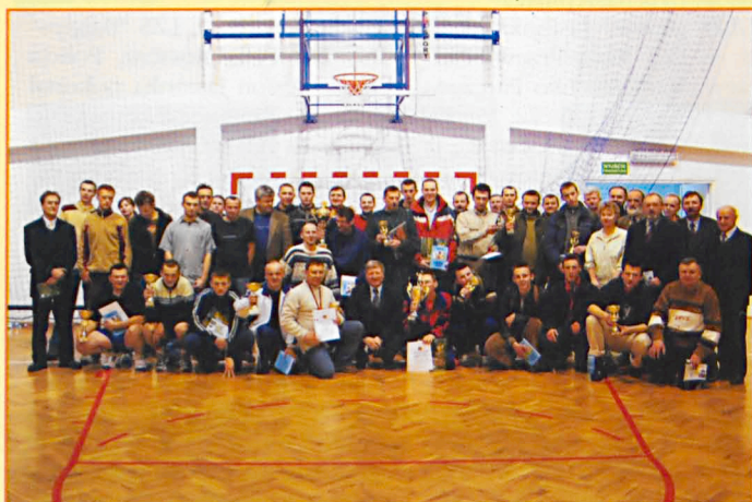
Uczestnicy turnieju piłki siatkowej w Sosnowicy