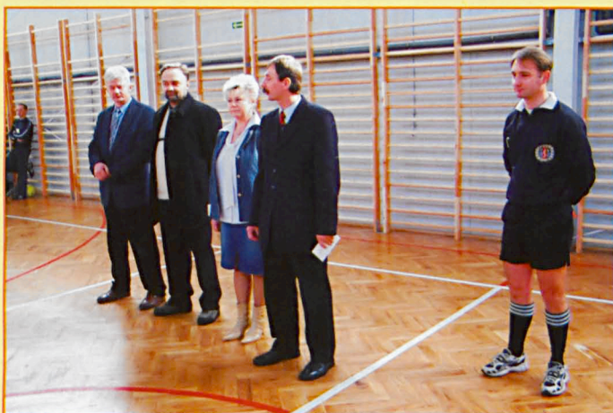
Organizatorzy turniejów sportowych w Sosnowicy