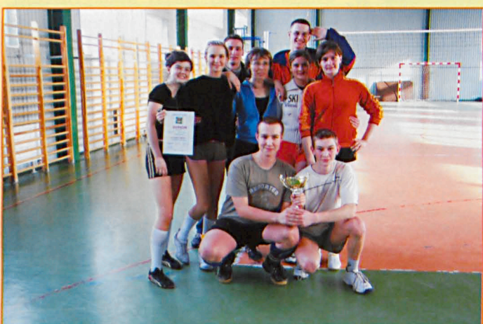
Drużyna LO Parczew