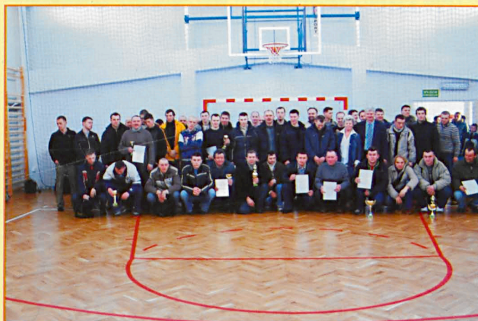
Uczestnicy turnieju halowej piłki nożnej w Sosnowicy