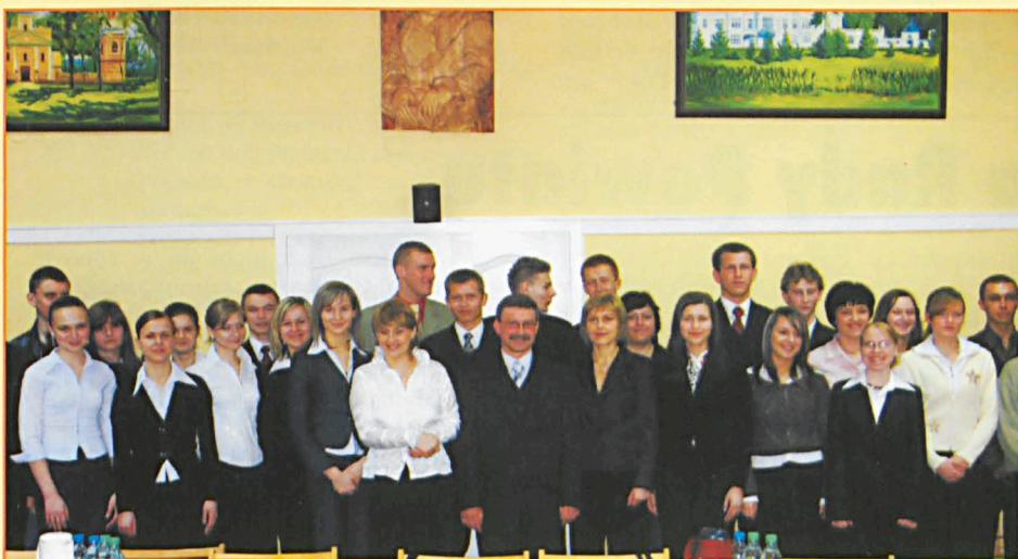
Laureaci stypendium Starosty po uroczystości wręczenia

Nr 4(47) kwiecień 2006 Miesięcznik społeczno-kulturalny Powiatu Parczewskiego Rok V cena: 1,50 zł (w tym 7% VAT)