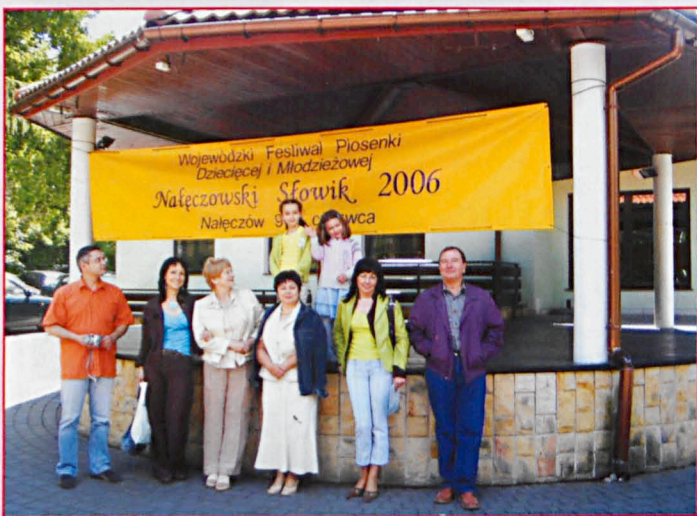
Uczestniczki Festiwalu wraz z opiekunami w Nałęczowie