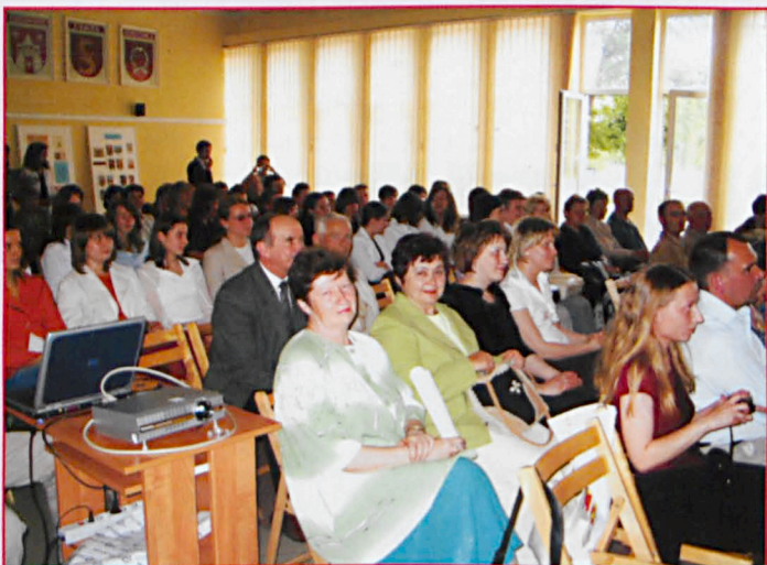
Uczestnicy spotkania Sienkiewiczowskiego