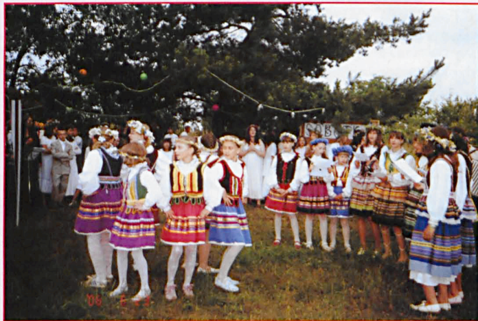
Młodzież z Gimnazjum w Parczewie i zespół z PDK podczas występów na Sobótce w Parczewie