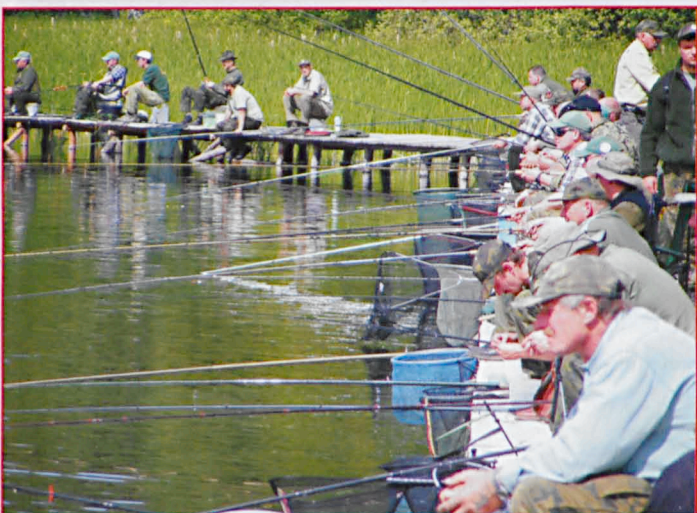
Mistrzostwa leśników w wędkarstwie jeziorowym na jeziorze "Czarne"