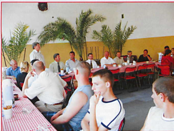
Rozpoczęcie V Pleneru Rzeźbiarskiego w Jabłoni