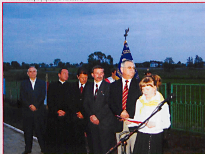
Sadzenie dębów w Przewłocze