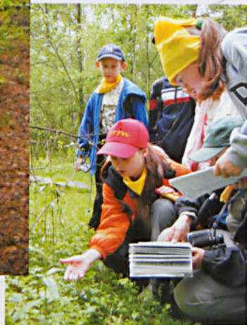
Obserwacje flory i fauny rozpoznawanie wg przewodnika