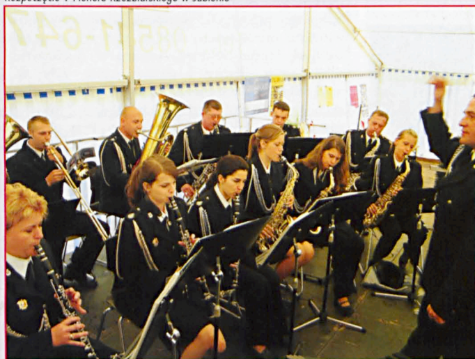
Koncert Orkiestry Dętej OSP w Milanowie