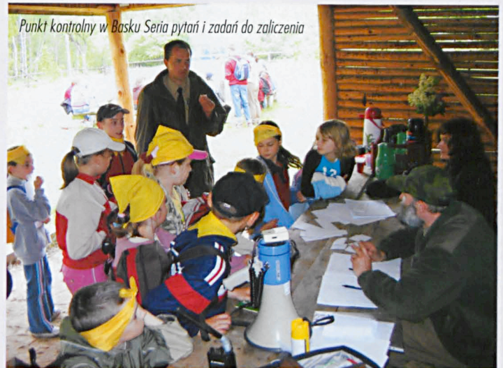
Punkt kontrolny w Basku. Seria pytań i zadań do zaliczenia