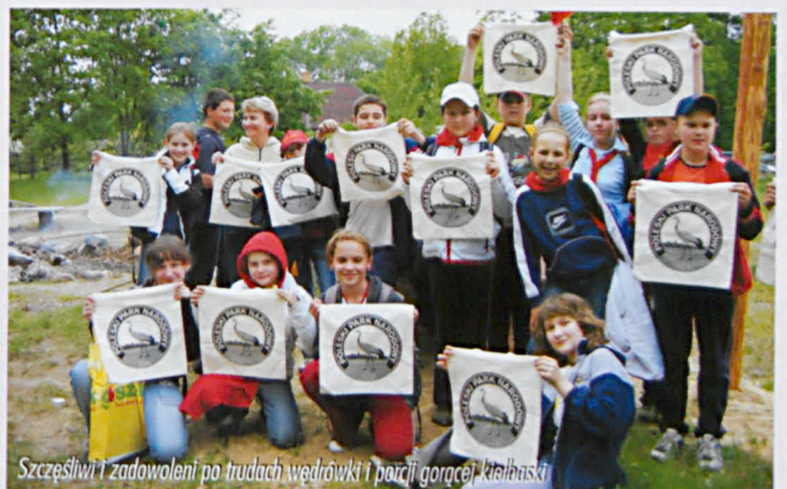
Šzczęśliwi i zadowoleni po trudach wędrowki i porcji gorącej kielbaski