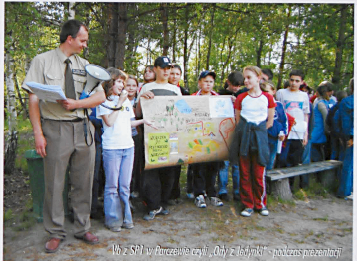
Vb z SP1 w Parczewie czyli „Orły z Jedyнки” - podczas prezentacji