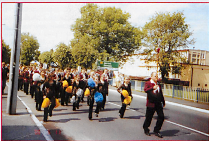
Orkiestra Dęta UM w Parczewie