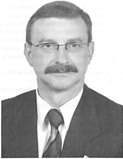
mgr inż. Waldemar Wezgraj Starosta Parczewski