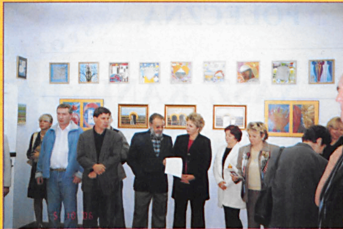
Otwarcie wystawy grafiki komputerowej w PDK w Parczewie