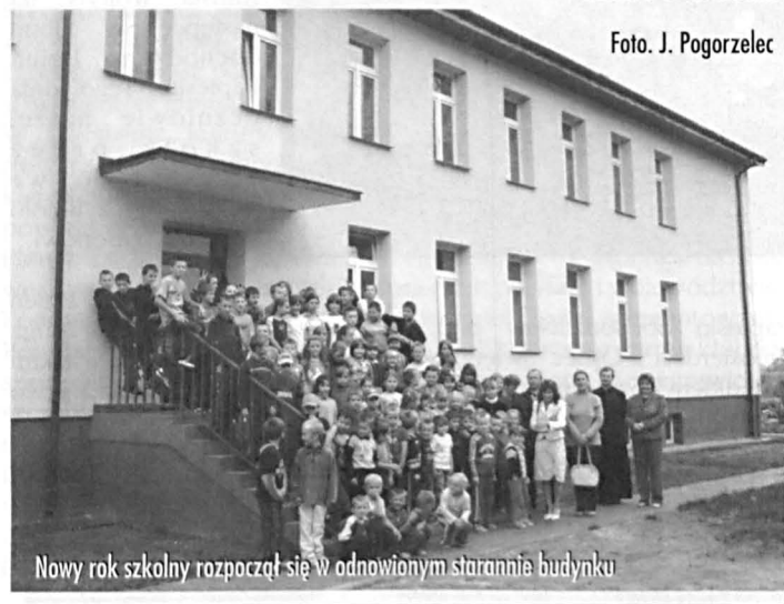
Nowy rok szkolny rozpoczął się w odnowionym starannie budynku