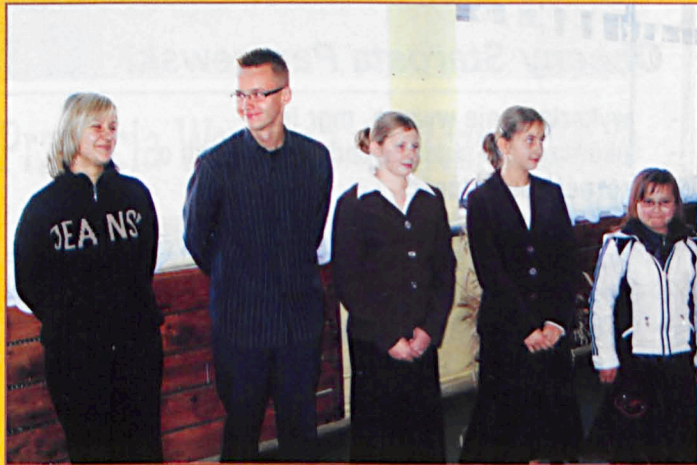
Laureaci konkursu recytatorskiego w Dębowej Kłodzie