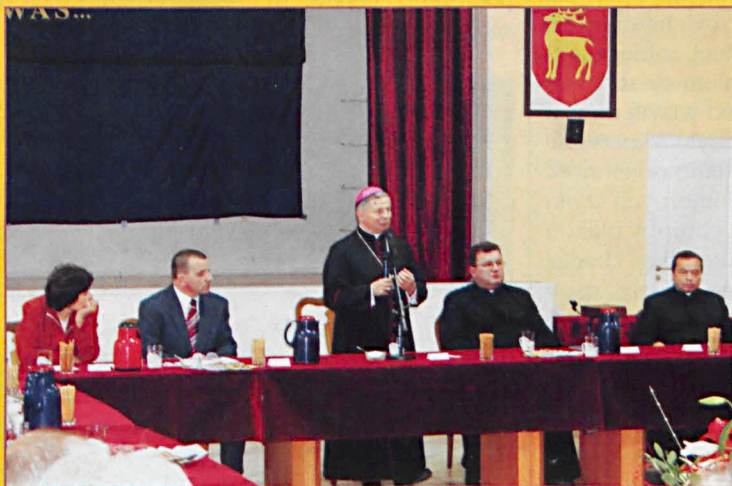
Wystąpienie ks. biskupa H. Tomasika podczas sesji