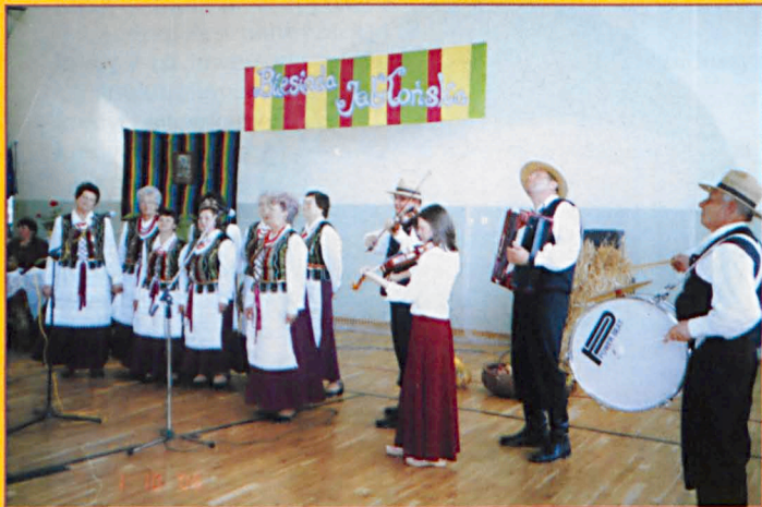
Dysowiacy z Dysa na Biesiadzie w Jabloniu