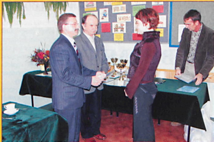
Podsumowanie współzawodnictwa sportowego szkół