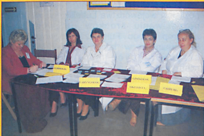
Biała Niedziela w Parczewie