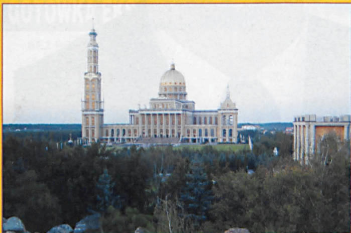
Licheń - cel pielgrzymki z Jasienki