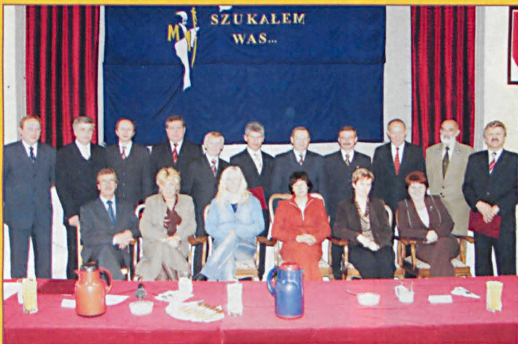
Rodzinne zdjęcie Zarządu i Rady Powiatu