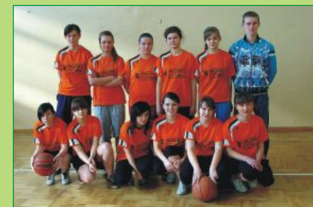
Drużyna dziewcząt Zespołu Szkół Ponadgimnazjalnych w Milanowie