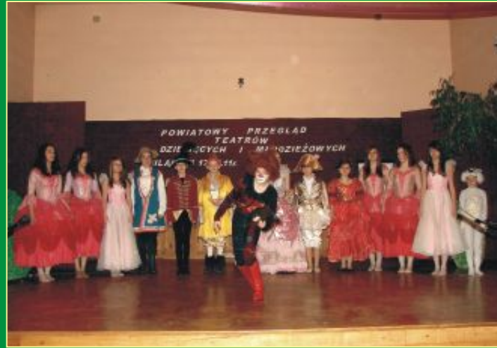
Grupa Teatralna Empatia z PDK Parczew

Nr 3 (106) marzec 2011 Miesięcznik społeczno-kulturalny Powiatu Parczewskiego Rok X