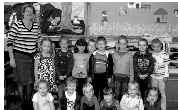
Na zdjęciu autorka i dzieci z kl. 0 w 2010 r.