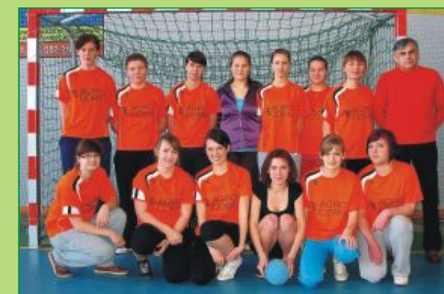
Drużyna dziewcząt Zespołu Szkół Ponadgimnazjalnych w Milanowie