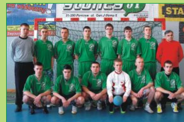
Drużyna chłopców Zespołu Szkół Ponadgimnazjalnych w Milanowie