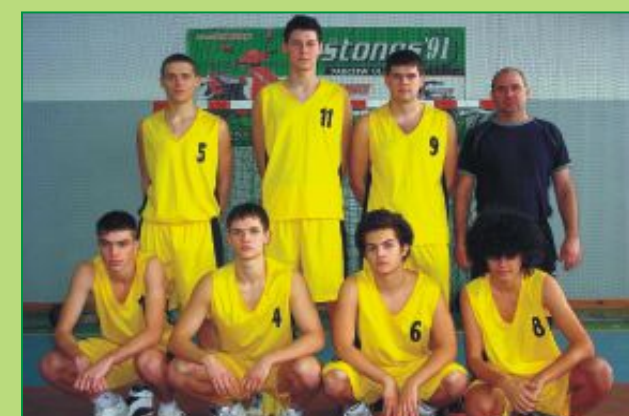
Drużyna chłopców I Liceum Ogólnokształcącego w Parczewie