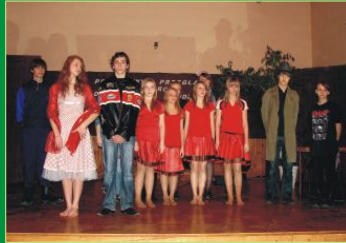
Grupa Teatralna z Gimnazjum "Kolek w płocie" z Milanowa