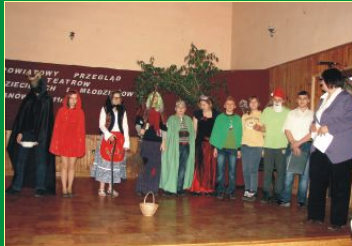
Grupa Teatralna Szkoły Podstawowej w Kodeńcu