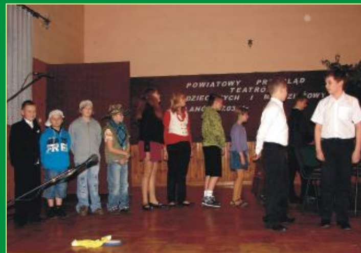
Grupa teatralna ze Szkoły Podstawowej Milków