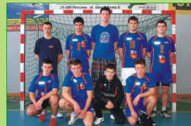
Drużyna chłopców I Liceum Ogólnokształcącego w Parczewie