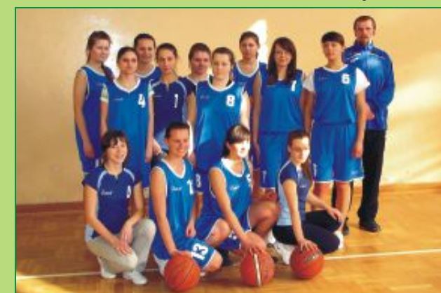
Drużyna dziewcząt I Liceum Ogólnokształcącego w Parczewie