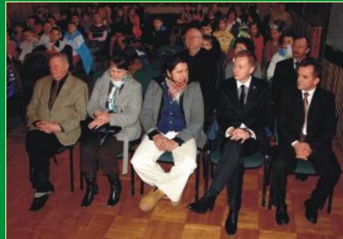
Uczestnicy Przeglądu Teatrów Dziecięcych i Młodzieżowych w Milanowie