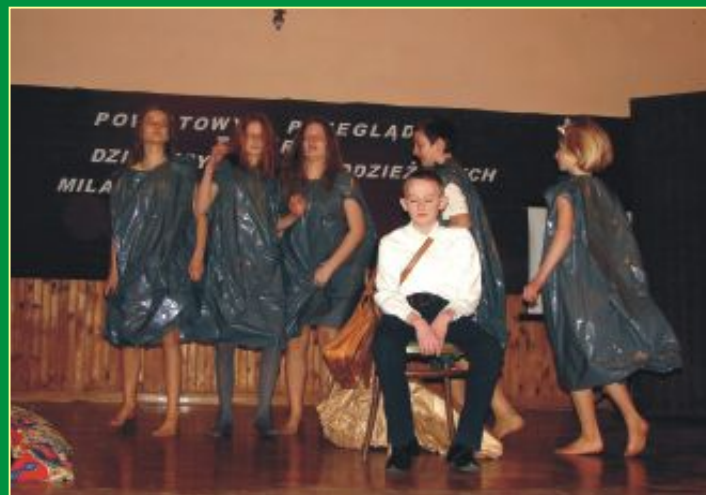
Dzieci z Zespołu "Chałupa" z Paszenek