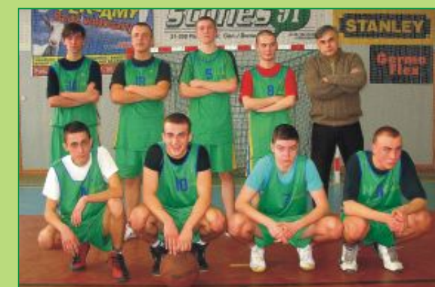
Drużyna chłopców Zespołu Szkół Ponadgimnazjalnych w Milanowie