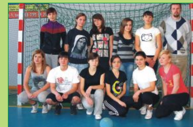
Drużyna dziewcząt I Liceum Ogólnokształcącego w Parczewie