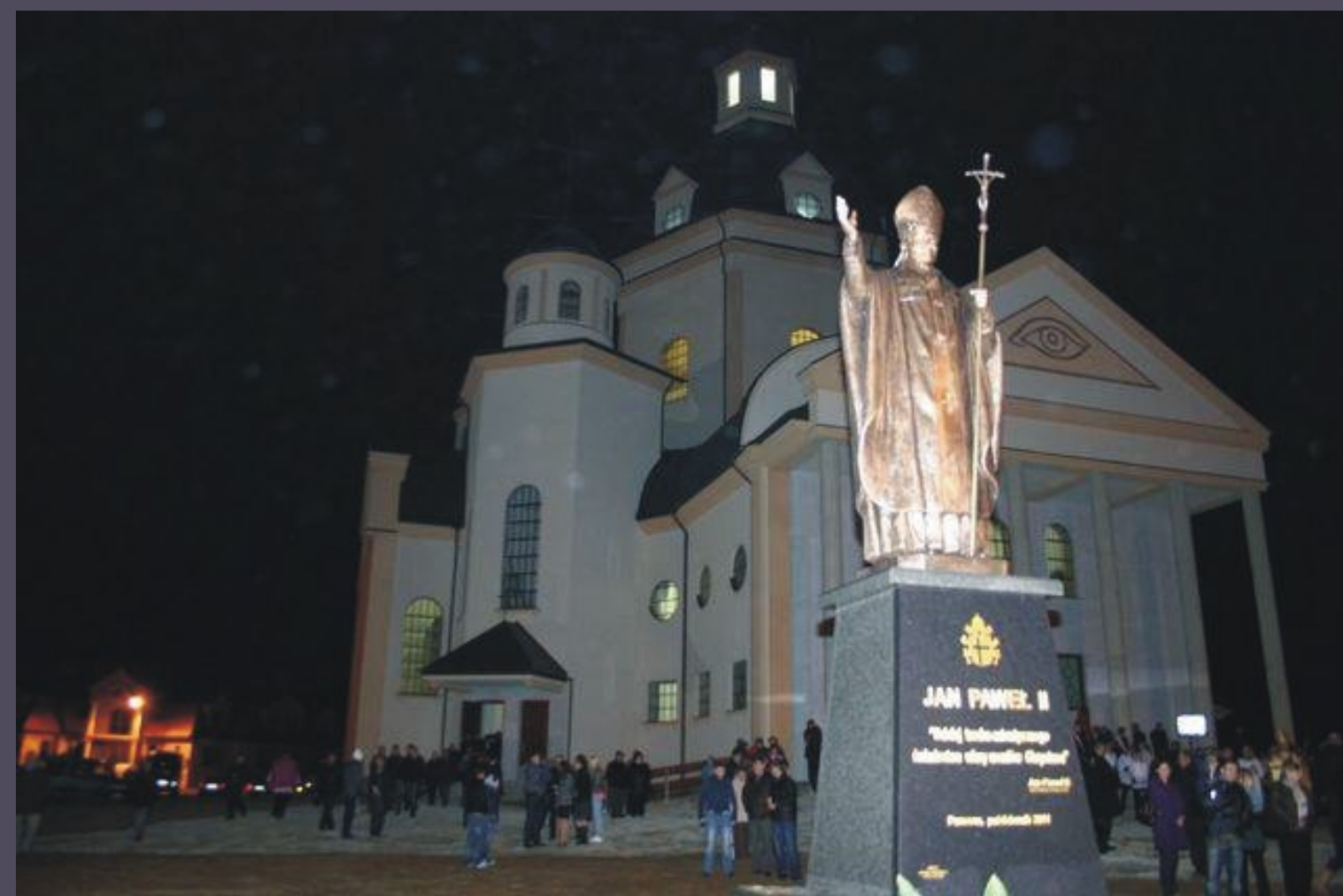
Konsekracja Kościoła pw. Opatrzności Bożej w Parczewie