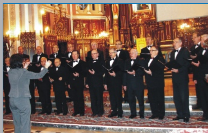
Męski CHÓR „WIARUS” z Miejskiego Ośrodka Kultury w Międzyrzeczu Podlaskim