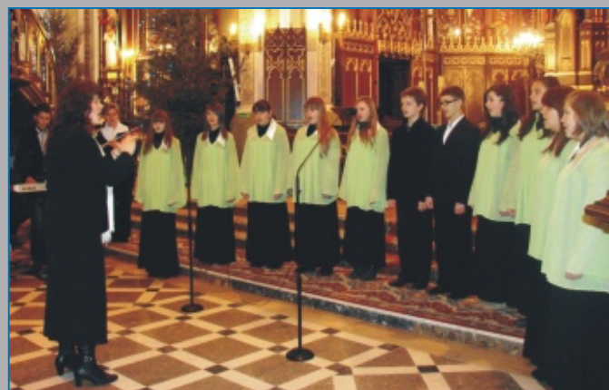
CHÓR „CON AMORE” z Publicznego Gimnazjum im. Władysława Jagielly w Parczewie