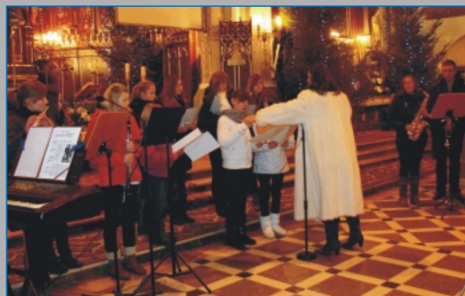
Młodzieżowy Chór Szkolny Prywatnej Szkoły Muzycznej I Stopnia w Parczewie