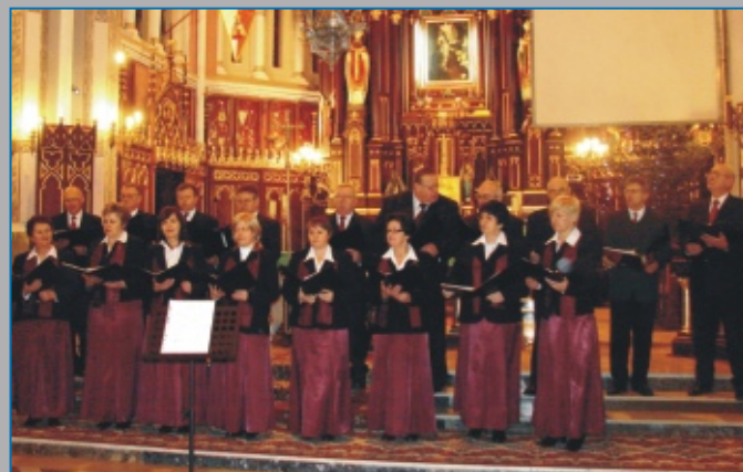
CHÓR PARAFIALNY z Parafii Niepokalanego Poczęcia NMP w Ostrowie Lubelskim