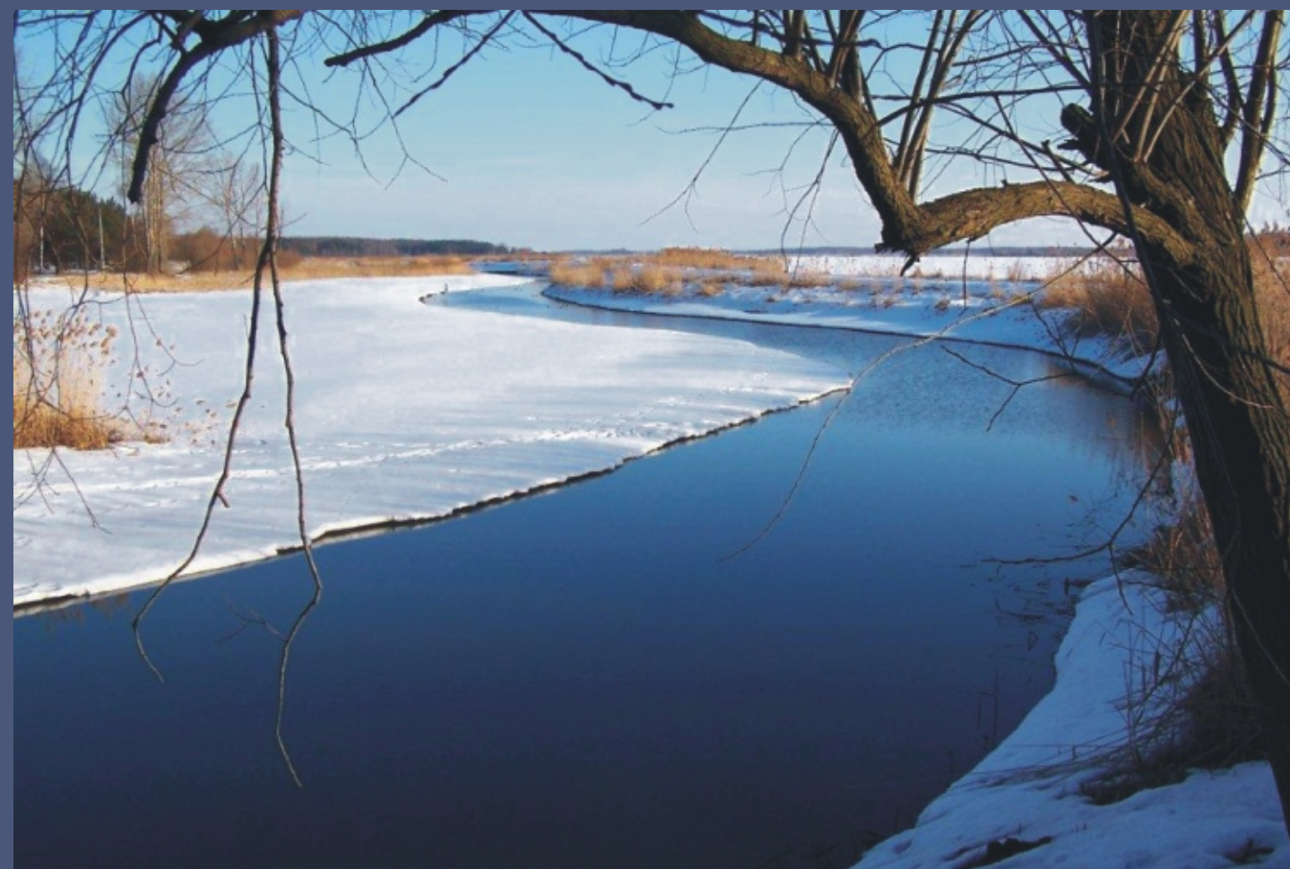
Zimowe uroki Gminy Siemień