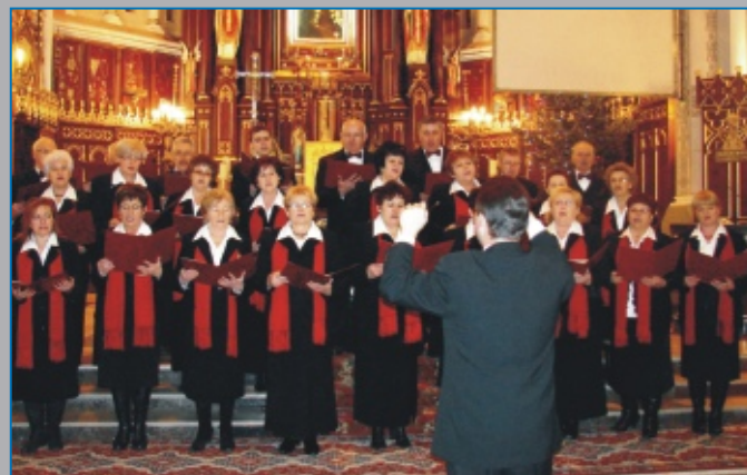
CHÓR PARAFIALNY z Parafii Opatrzności Bożej w Parczewie