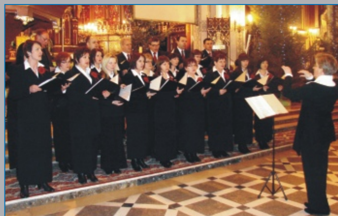
CHÓR „BEATI CANTORES” z Parafii Niepokalanego Poczęcia NMP w Milanowie