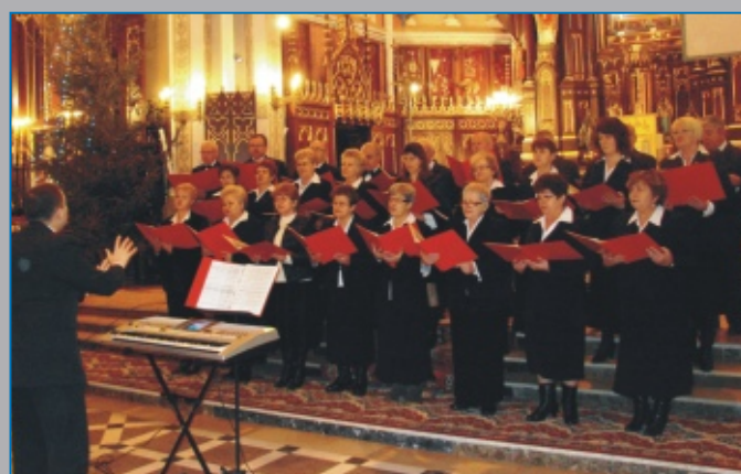
CHÓR „TIBI DOMINE” z Parafii Św. Jana Chrzciciela w Parczewie - Bazylika Mniejsza