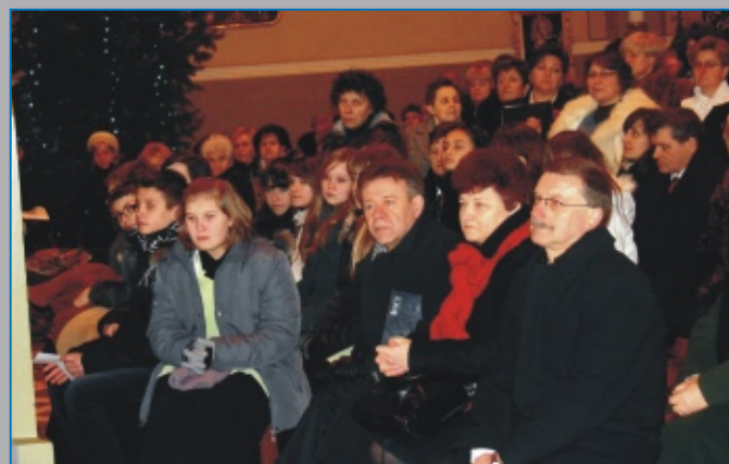
Uczestnicy V Prezentacji Chórów w Parczewie