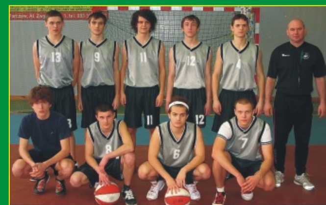
Drużyna I Liceum Ogólnokształcącego w Parczewie