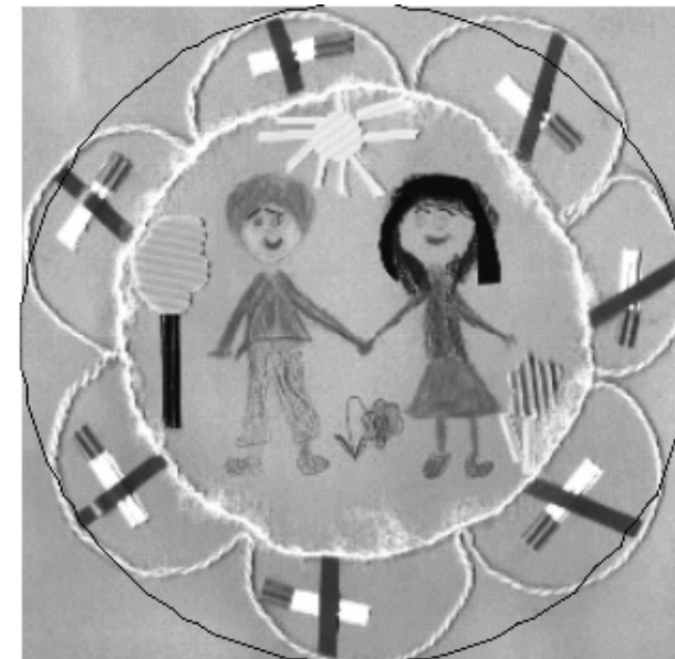
Nagrodzona praca Justyny Łopackiej