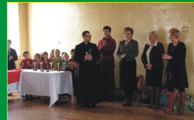
Mistrzostwa SZS Koszykówka chłopców Licealiada 2011/2012