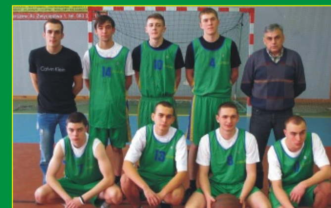
Drużyna Zespołu Szkół Ponadgimnazjalnych w Milanowa