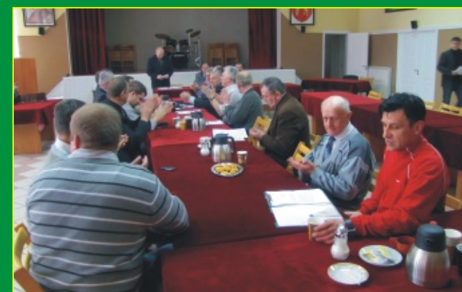
IV Powiatowy Zjazd Zrzeszenia Ludowych Zespołów Sportowych w Parczewie