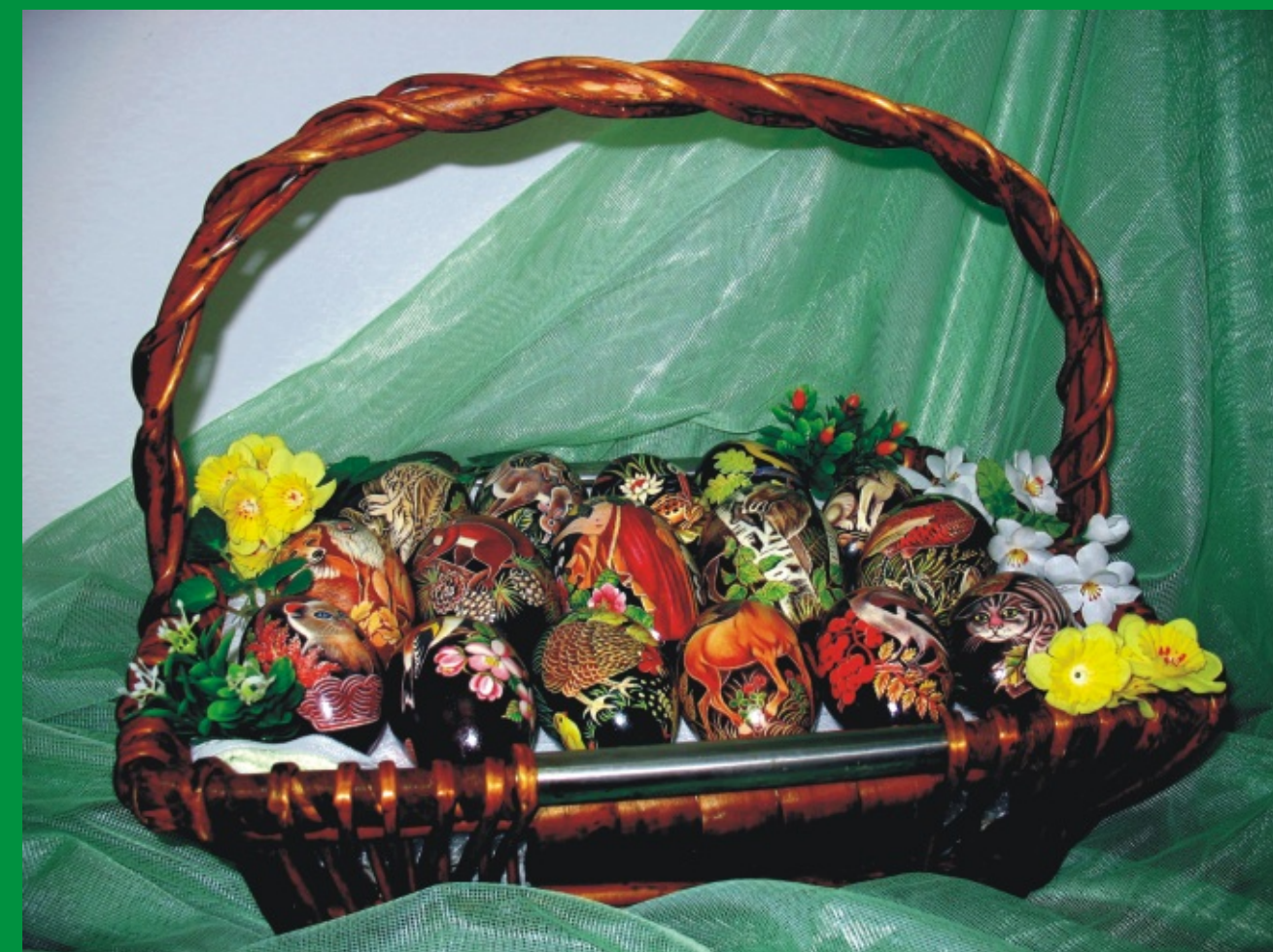
Wielkanocna wystawa w PDK Parczew

Zdrowych i Wesółych Świąt Wielkanocnych życzy