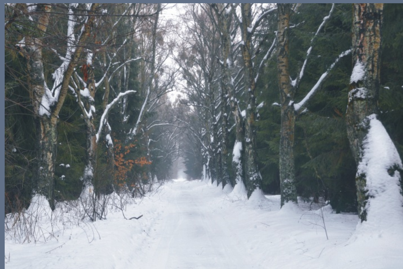
“Lasy Parczewskie - zimowy pejzaż”

Miesięcznik społeczno-kulturalny Powiatu Parczewskiego Rok XII