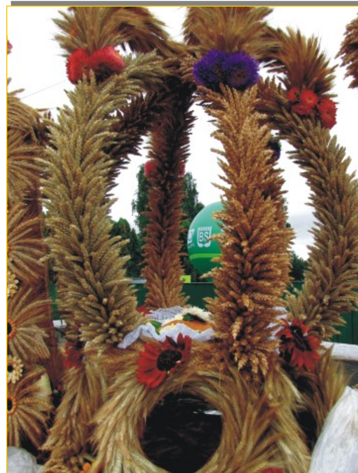
Wieniec Zespołu Ludowego "Jarzębina" z Paszenek