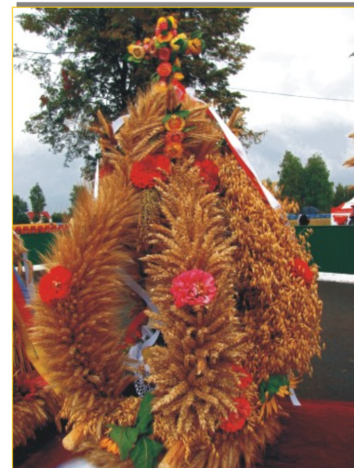
II Miejsce Zespół Ludowy Sosna z Sosnowicy