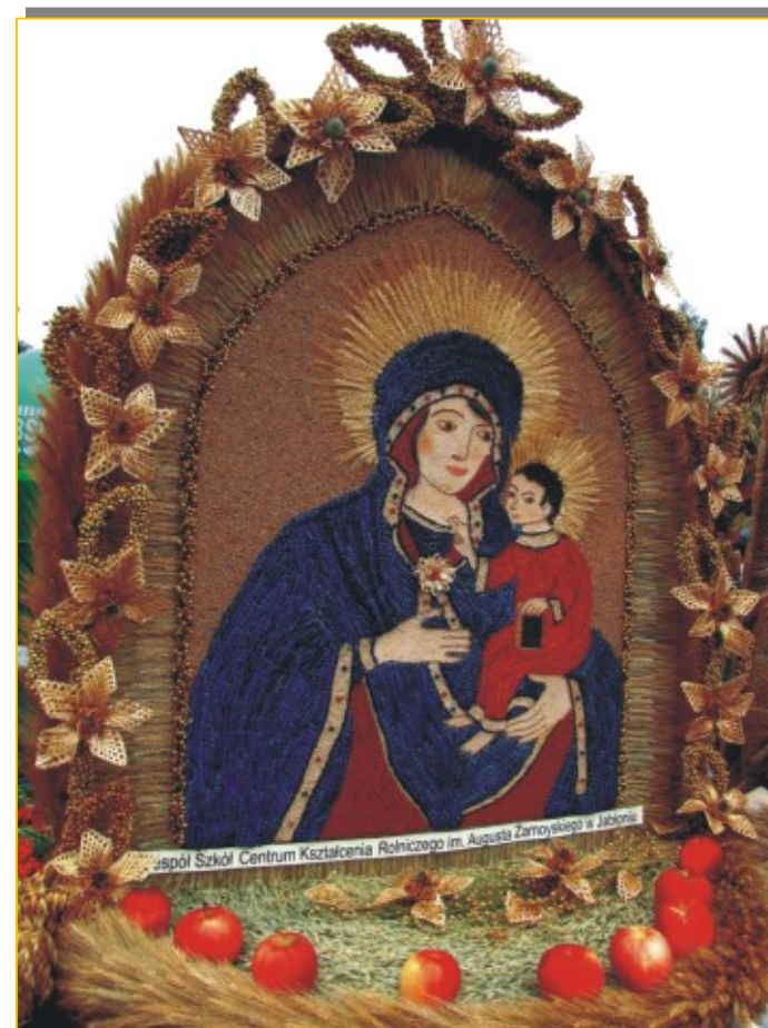
III Miejsce Zespół Szkół Centrum Kształcenia Rolniczego w Jabłoniu