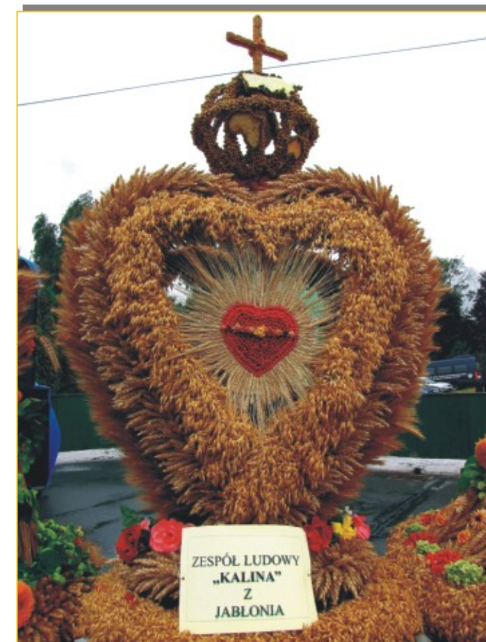
Wyróżnienie - Zespół Ludowy „Kalina” z Jabłonia