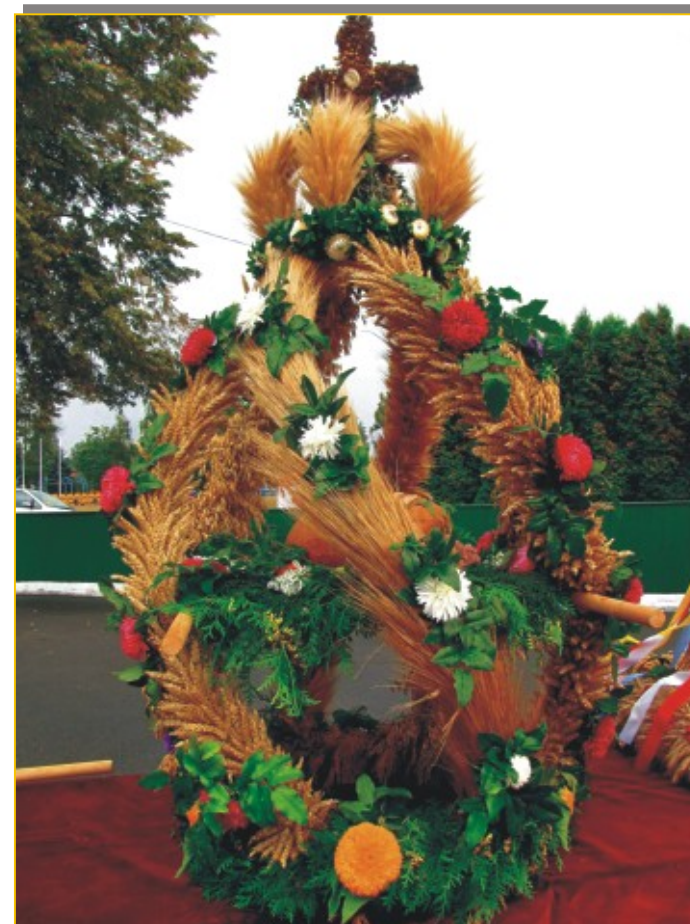
I miejsce - Mieszkańcy wsi Tyśmienica