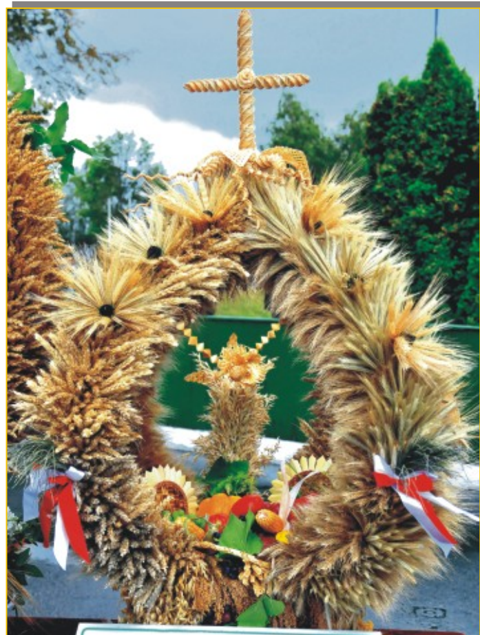
Wieniec Dzieci i Młodzieży z Zespołu Placówek Oświatowych w Podedwórzcu