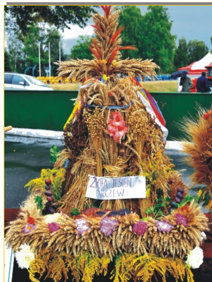
Wieniec Zespołu Wokalnego "Złota Jesień" z Parczewa