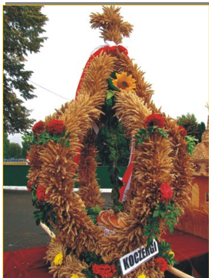
Wieniec Mieszkańców "Wsi Koczergi"