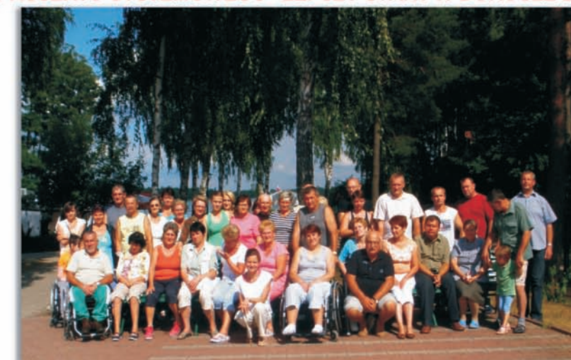
I tura pobytu rehabilitacyjno-szkoleniowego, Okuninka 2013