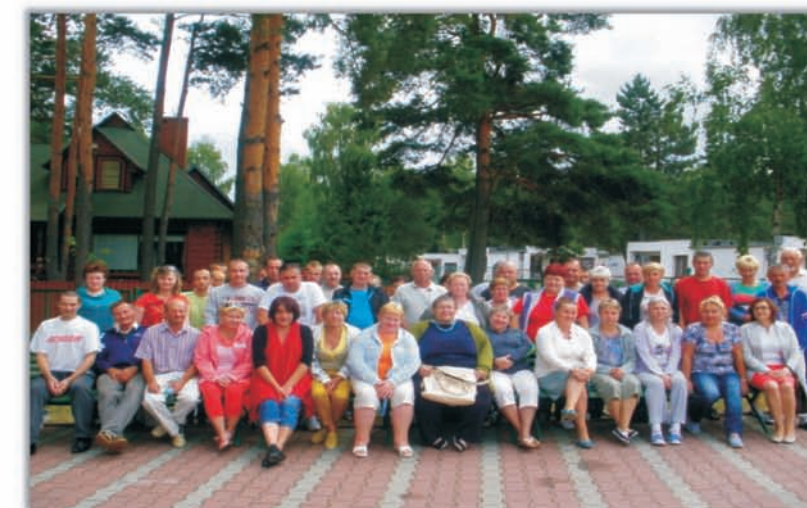
II tura pobytu rehabilitacyjno-szkoleniowego, Okuninka 2013