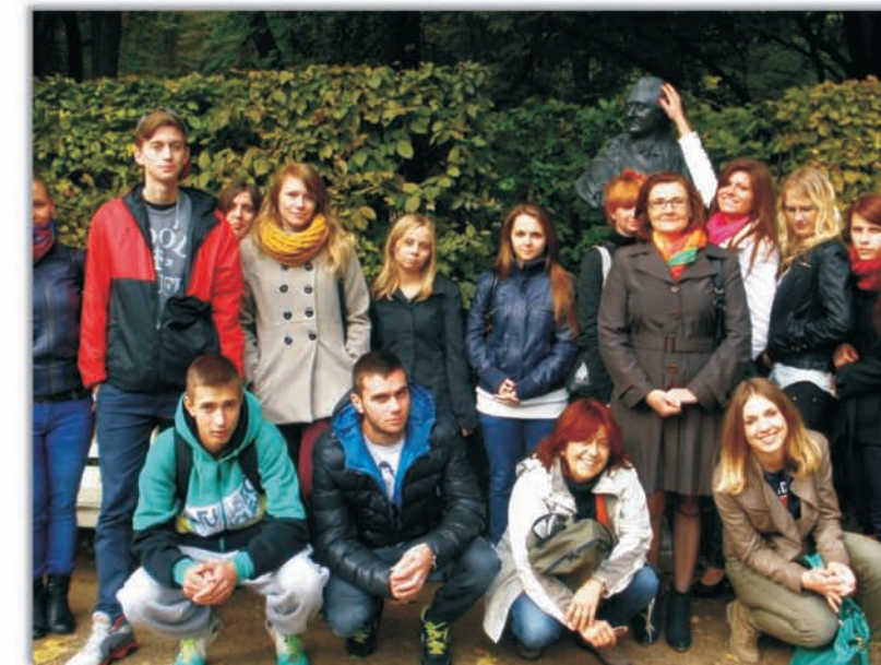
Wyjazd edukacyjno-integracyjny, Warszawa, 28.09.2013