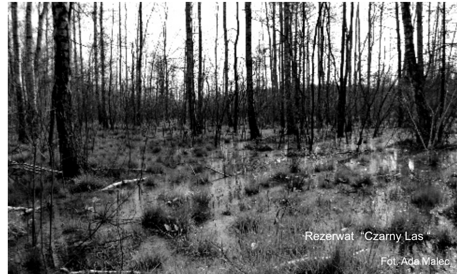
Rezerwat "Czarny Las"

Projekt spotkał się z przychylną opinią nauczycieli i uczniów, byli zadowoleni z uczestnictwa w realizacji programu, gdyż pogłębili swoją wiedzę, a także pożytecznie mogli zagospodarować swój czas wolny. U młodzieży jako bezpośredniego adresata tego programu nastąpił wzrost poziomu wiedzy z zakresu ekologii i ochrony środowiska, wyrobienie właściwych nawyków żywieniowych, nawyku segregowania śmieci oraz niedopuszczenie do rozrzutności i marnotrawstwa surowców, materiałów i energii.