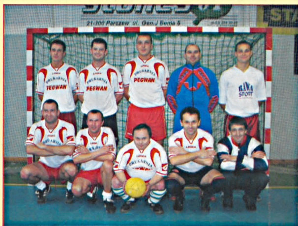
OLD STAR's Parzew