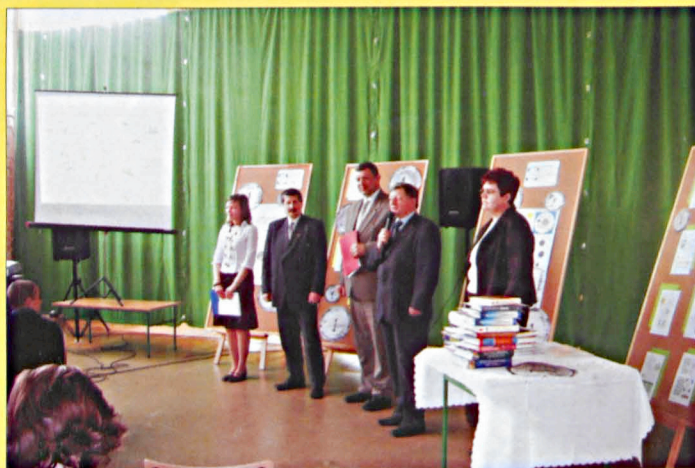
Podsumowanie I etapu szkolnego projektu „I Ty możesz zostać inwestorem” w Podedwórzcu