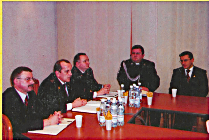
Uczestnicy narady w KP PSP w Parczewie