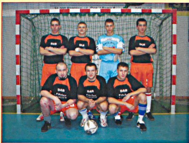
Dąb Dębowa Kłoda