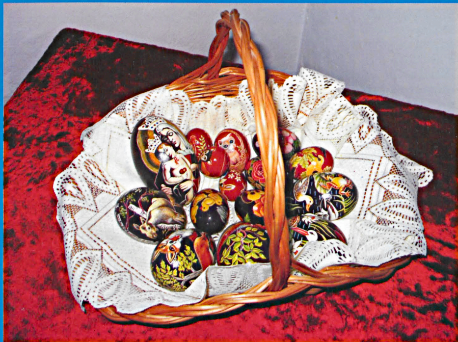
Wystawa pisanek w Parczewskim Domu Kultury

Nr 4 (59) kwiecień 2007 Miesięcznik społeczno-kulturalny Powiatu Parczewskiego Rok VI