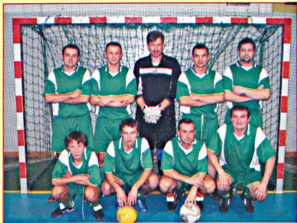
WODNIK I Siemień