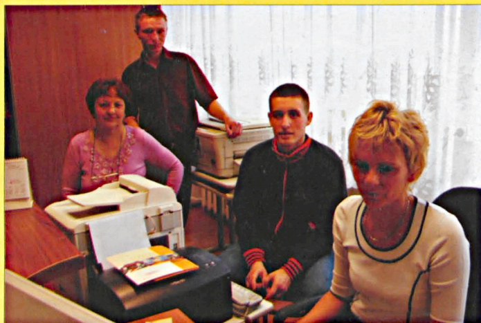
Młodzież z LO Parczew podczas Dni Przedsiębiorczości w Starostwie Powiatowym w Parczewie