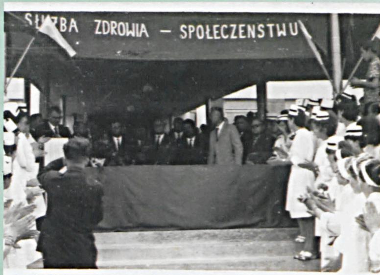
Otwarcie szpitala w Parczewie