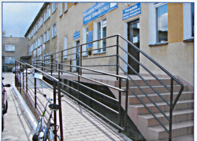
Wejście do poradni SPZ POZ