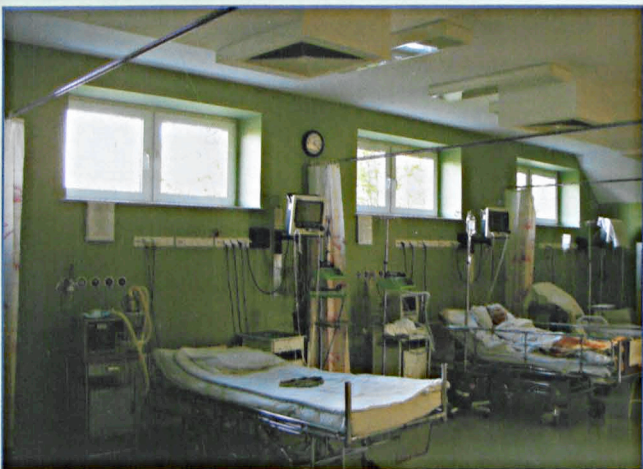
Oddział Anestezjologii i Intensywnej Terapii