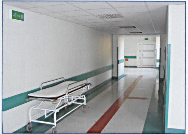
Ciąg komunikacyjny OIT