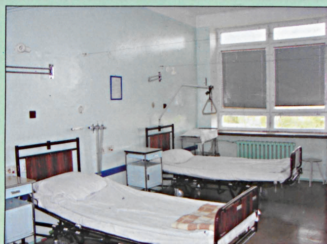
Sala chorych Oddziału Chirurgiczno-Urazowego