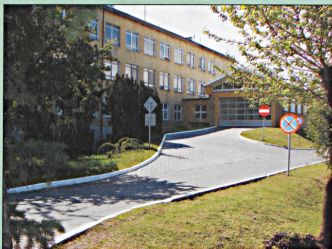
Podjazd Szpitalnego Oddziału Ratunkowego