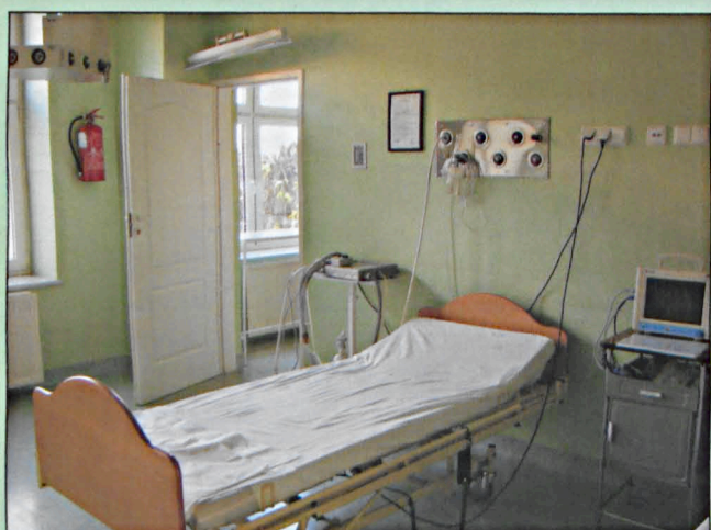
Oddział Intensywnej Terapii