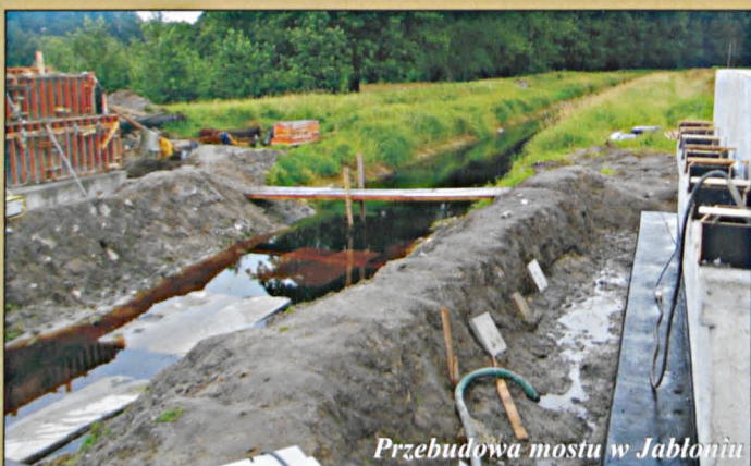
Przebudowa mostu w Jabloniu