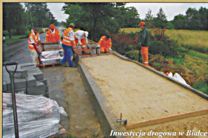
Inwestycja drogowa w Białce