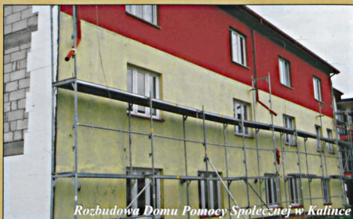
Rozbudowa Domu Pomocy Społecznej w Kalince