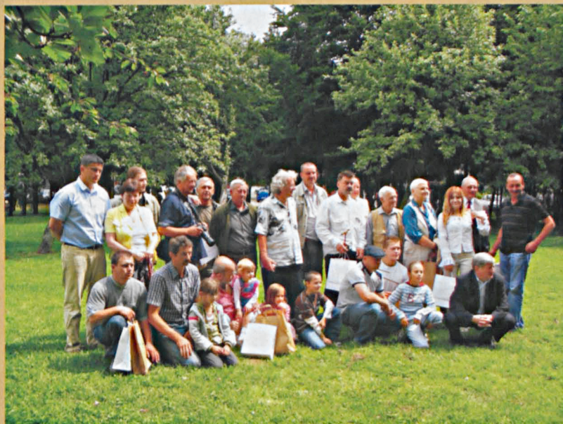
Organizatorzy i uczestnicy VIII Pleneru Rzeźbiarskiego w Jabłoni