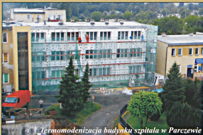
Termomodernizacja budynku szpitala w Parczewie