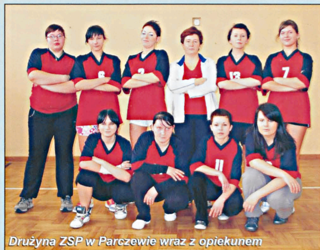
Drużyna ZSP w Parczewie wraz z opiekunem