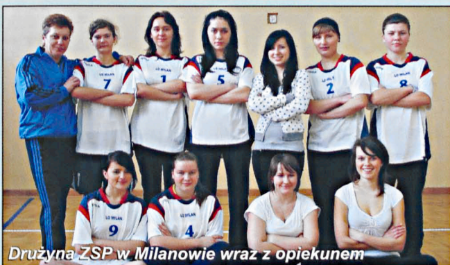
Drużyna ZSP w Milanowie wraz z opiekunem