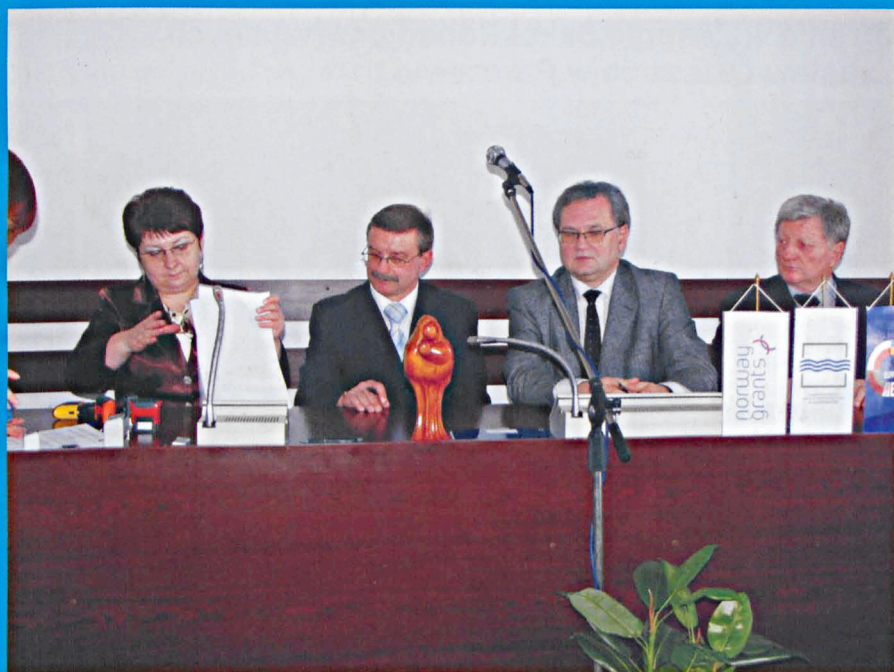
Podpisanie umowy przez przedstawicieli Powiatu Parczewskiego i Euroregionu BUG na realizację partnerskiego projektu z Ukrainą

Miesięcznik społeczno-kulturalny Powiatu Parczewskiego Rok VIII