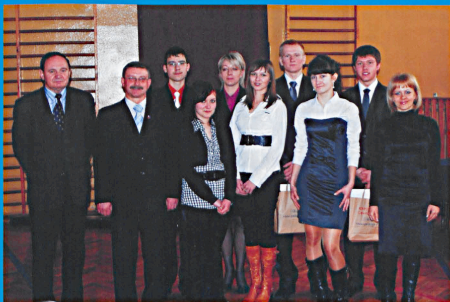
Organizatorzy i Laureaci konkursu Anglojęzycznego w Zespole Szkół Ponadgimnazjalnych w Parczewie