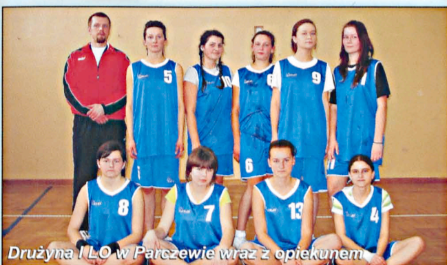
Drużyna I LO w Parczewie wraz z opiekunem