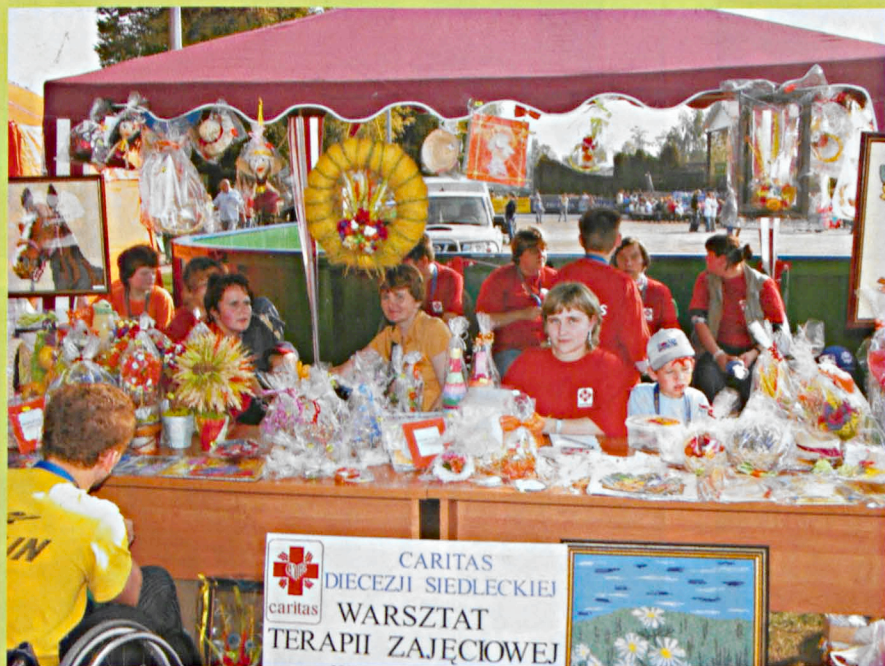
Wystawa prac uczestników Warsztatu Terapii Zajęciowej w Parczewie