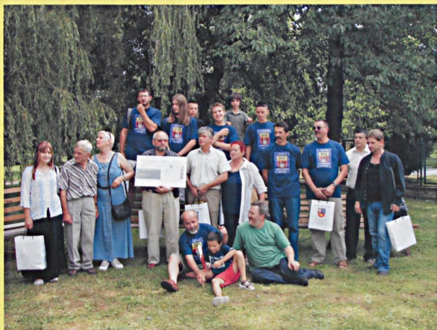
Uczestnicy VII Międzynarodowego Pleneru Rzeźbiarskiego w Jabłoni