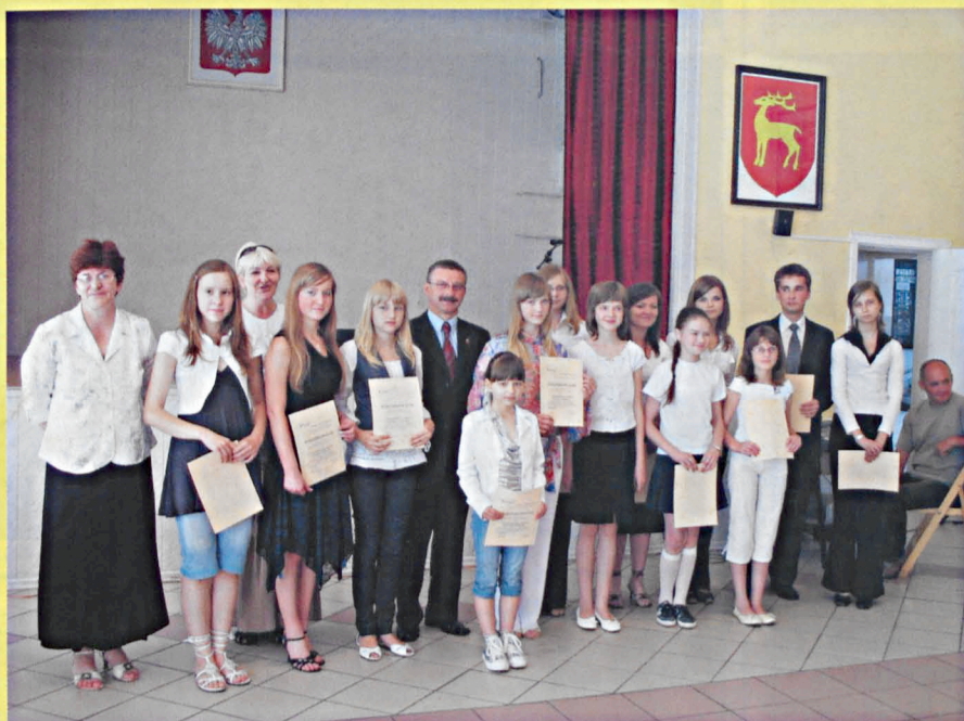
Stypendyści Powiatu Parczewskiego w dziedzinie twórczości artystycznej

Nr 7/8 (74/75) Lipiec - Sierpień 2008 Miesięcznik społeczno-kulturalny Powiatu Parczewskiego Rok VII