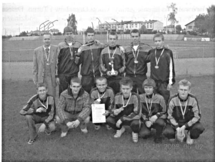
Mistrzowska drużyna biegaczy z parczewskiego gimnazjum