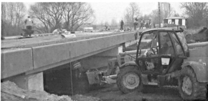
Remontowany most w Koczergach