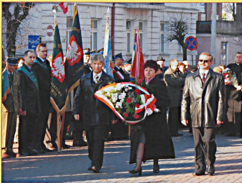
Delegacja samorządu Powiatu Parczewskiego podczas uroczystości Święta Niepodległości w Parczewie