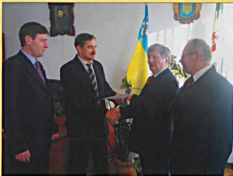
Przedstawiciele Starostwa Powiatowego w Parczewie z wizytą w Lubomlu na Ukrainie