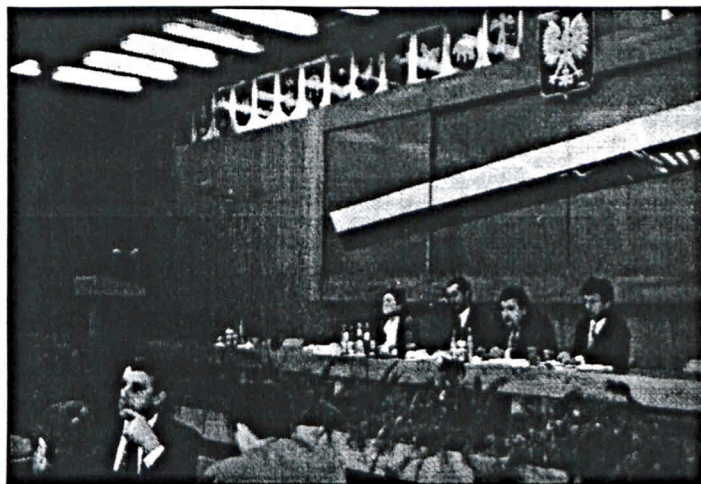
Nad sprawnością obrad czuwał Zarząd.

mentarnych, rządowych i administracyjnych) o podjęcie natychmiastowych działań w kierunku poprawy obecnej sytuacji w rolnictwie oraz w celu zapewnienia godziwych warunków życia społeczności wiejskiej.