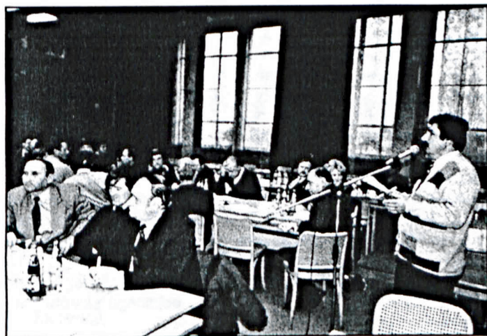
Nie brakowało wystąpień i dyskusji.

Walne Zgromadzenie obradujące w dniu 17.11.97 r. kieruje apel do wszystkich instancji państwowych (parla-