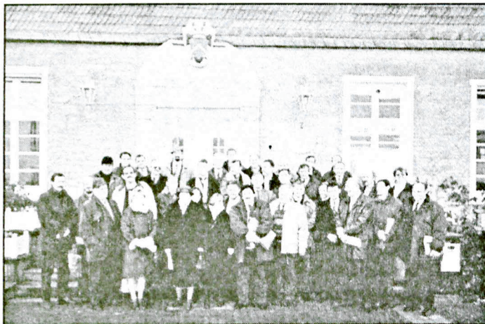
Delegacji BIR przed Ośrodkiem Szkoleniowym w Haus-Düse.

Zapoznano się z systemem kształcenia młodzieży w szkołach rolniczych, wizytowano Ośrodek Szkoleniowy Izby Rolniczej, wraz z jego gospodarstwem w miejscowości Haus Düse, gdzie przyszli adepci zawodu rolnika nabywają umiejętności praktyczne do prowadzenia gospodarstwa.