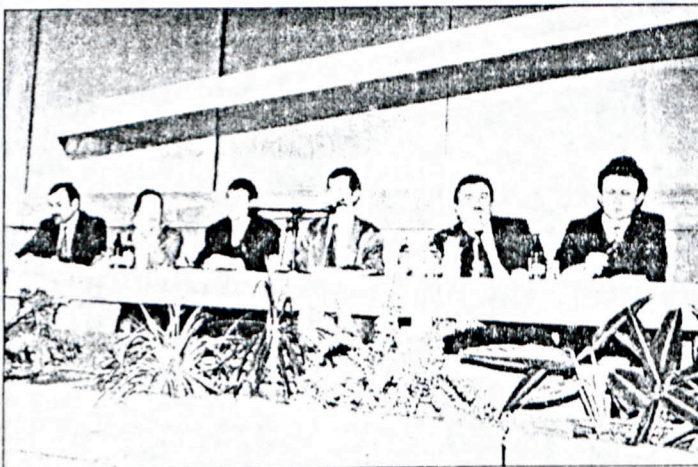
Zarząd Izby prowadzi obrady Walnego Zgromadzenia

Niestety z uwagi na późną porę nie udało się rozstrzygnąć wszystkich kwestii związanych z budżetem BIR na 1998 r. Obrady zamknięto i postanowiono by projekt budżetu jeszcze raz był przedmiotem prac Zarządu i Komisji Budżetowej BIR.