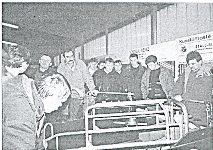
Uczesnicy oglądają urządzenia stanowiące wyposażenie chlewni.

Ośrodek doświadczalny w Wehnen służy między innymi rolnikom zrzeszonym w Związku Hodowców Świń do odbywania szkoleń podnoszących ich kwalifikacje. Ponadto kształcą się tu młodzi ludzie, przejmujący gospodarstwa oraz pracownicy ośrodka, którzy co dwa lata przez jeden tydzień kształcą się przechodząc cały cykl produkcyjny. Rocznie kształca się tutaj korzystając z bazy socjalnej ośrodka około 700 rolników z 16 branż (łącznie z komputerową).