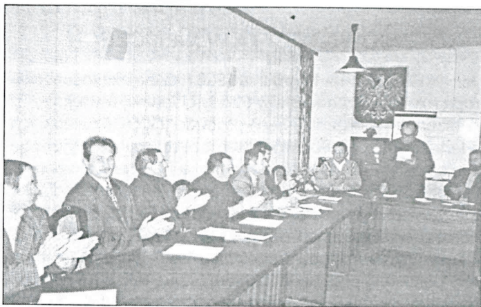
Reprezentanci grup producenckich bezpośrednio po podpisaniu porozumienia