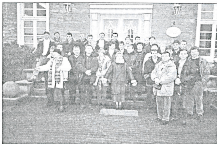
Uczestnicy wyjazdu przed Ośrodkiem Szkoleniowym Izby Rolniczej w Haus Düsse.

System wynagradzania dostawców żywca uwzględnia premiowanie dostawców tuczników o wysokiej mięsności tzn. powyżej 56% ( próg premiowania ) oraz