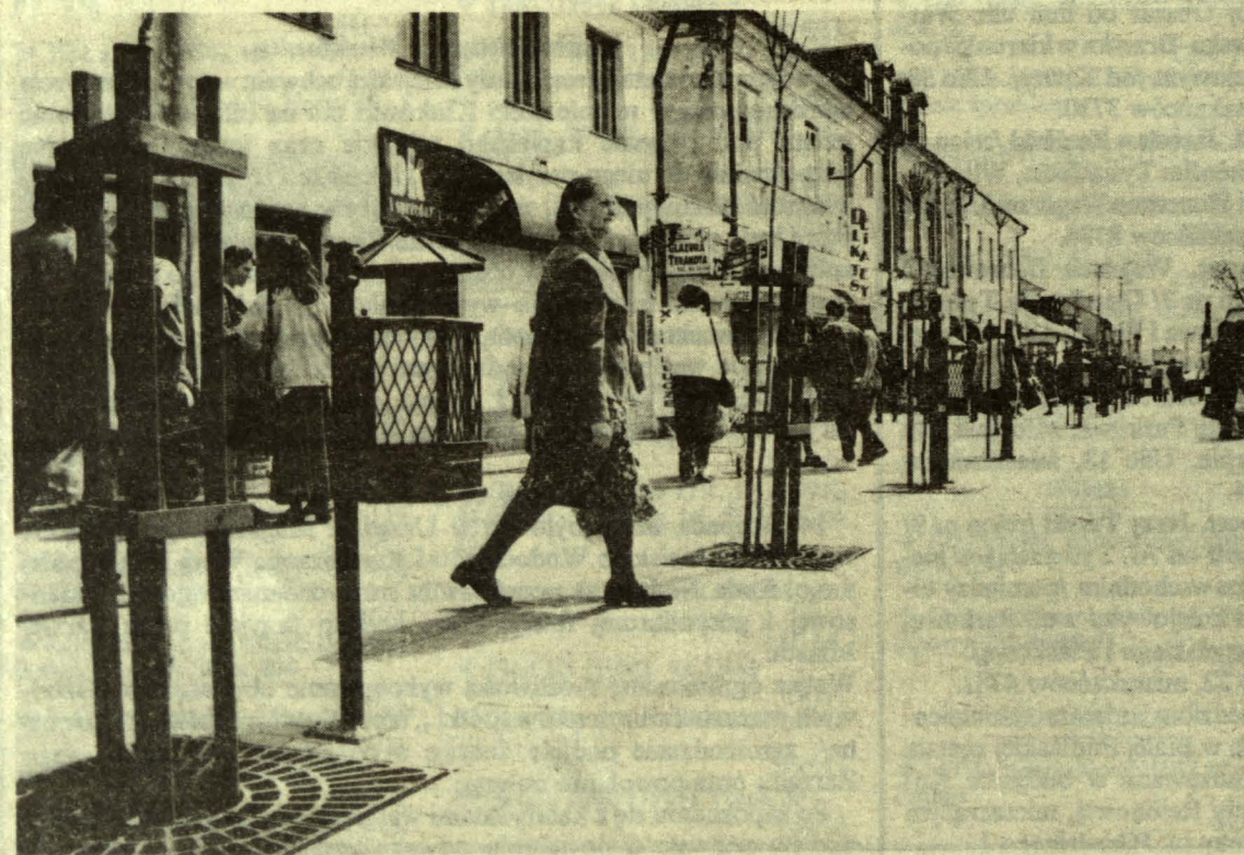
Promenada na ulicy Brzeskiej wskazuje kierunek przemian jakim wkrótce zostanie poddany cały Plac Wolności