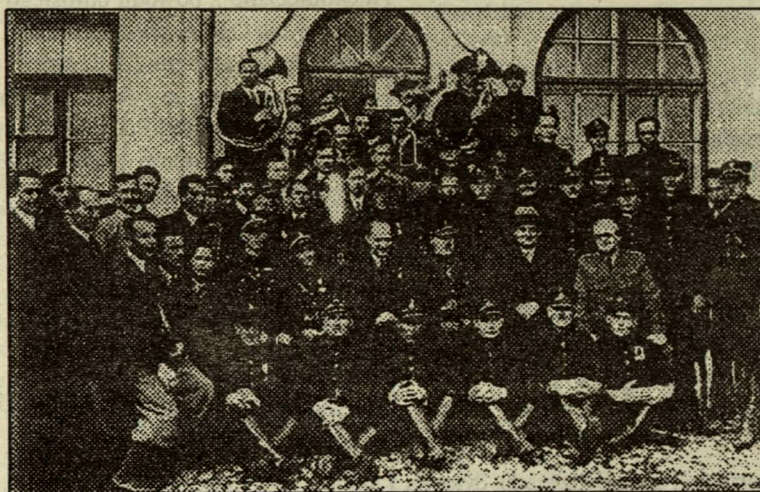
Ochotnicza Straż Pożarna i chór Podlaskiej Wytwórni Samolotów. Biała Podlaska ok. 1938 r.

Już w 1919 roku rozpoczęto prace nad odbudową fabryki Raabego, która uległa znacznym zniszczeniom w latach 1914-1918 (podpalenie przez wojska rosyjskie, wywózka maszyn przez Niemców). Pomimo odbudowy, produkcja była początkowo niższa o 30 proc.-40 proc. w stosunku do przedwojennej. Wpływ na to miało odcięcie od dawnego rosyjskiego rynku wschodniego. Stopniowo jednak fabryka przetwórstwa drzewnego wprowadzała nowe technologie oraz rozszerzała asortyment produkcji, rugując nawet zagraniczną konkurencję z rynku krajowego. Decydujące jednak znaczenie dla rozwoju Białej w tym okresie miała Podlaska Wytwórnia Samolotów, wybudowana w latach 1924-1925 na przedmieściu Wola. W początkowym okresie swojego istnienia fabryka produkowała samoloty na licencji zagranicznej, później przechodziła stopniowo na produkcję samolotów polskich konstruktorów. W latach 1929-1932 były wyrabiane także karoserie samocho-