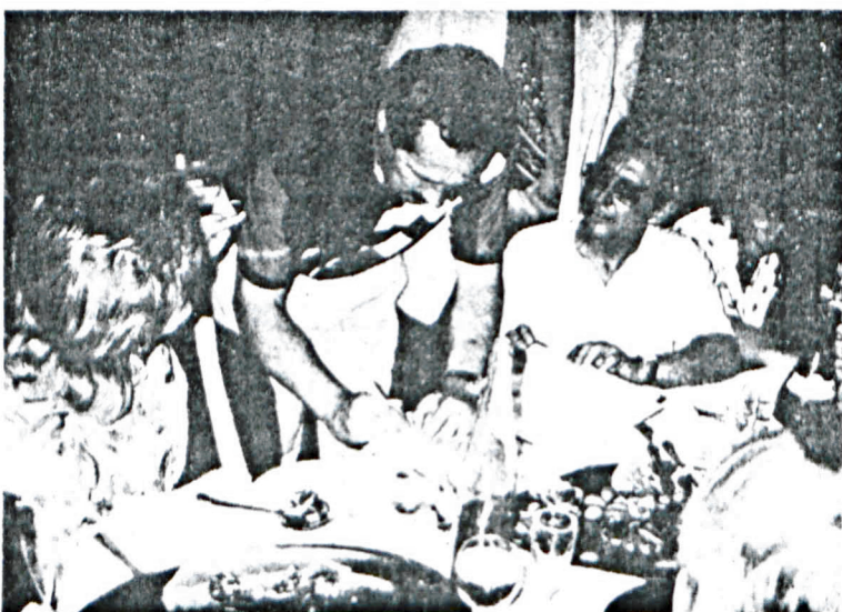
Podpisywanie umowy o współpracy miast

realizację wspólnych przedsięwzięć oraz inicjować wymianę doświadczeń pomiędzy instytucjami i organizacjami obu miast. Przewidziana jest m.in. stała wymiana informacji o funkcjonowaniu tych miast, życiu jego mieszkańców oraz działalności miejscowych organów samorządowych. Szczególnie wspierane będą dążenia zmierzające do wzajemnej wymiany grup młodzieży szkolnej oraz zespołów artystycznych.