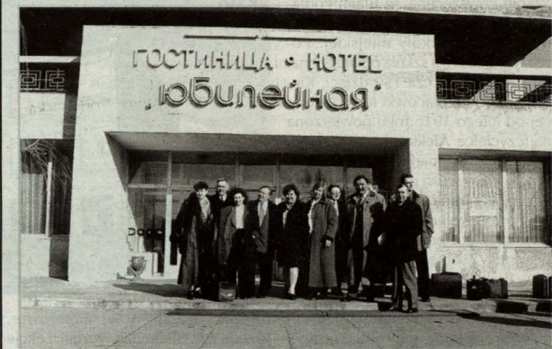
Grupa białskich przedsiębiorców przed hotelem w Bobrujsku