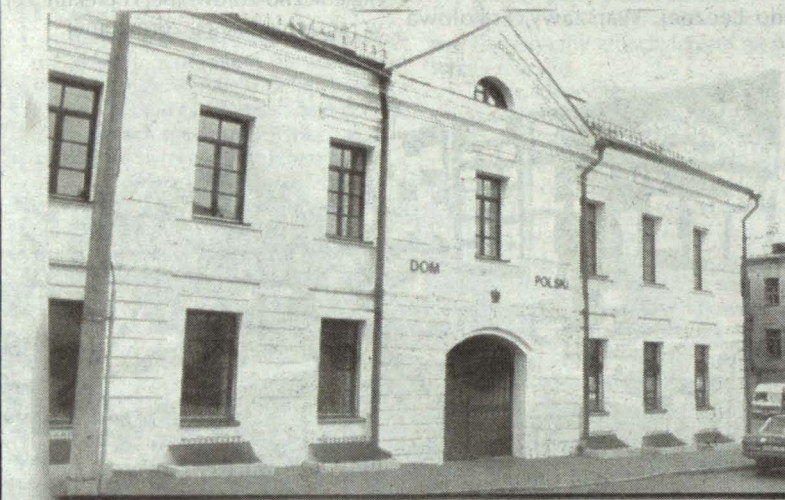
Dom Polski w Mohylewie