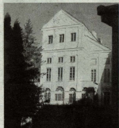
Fragment Pałacu Radziwiłłów w Nieświeżu