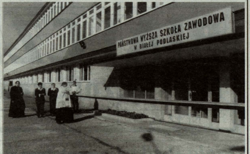
Zarząd Miasta przekazał nieodpłatnie Państwowej Wyższej Szkole Zawodowej budynek administracyjny ZPW „Białena”. Adaptacji obiektu na potrzeby uczelni dokonano ze środków samorządowych i PWSzZ. Wyremontowano pomieszczenia o powierzchni 1769 mkw. Znalazło się w nich 17 sal lekcyjnych i 2 komputerowe. Oficjalne przekazanie budynku nastąpiło 11 września.

W ramach zadań inwestycyjnych wykonano: chodnik na ul. Podleśnej, kanalizację deszczową odwadniającą ul. Kolejową oraz ul. Sielczyk (odcinek od ul. Gwardii Ludowej do ul. Langiewicza). Rozpoczęto też modernizację ul. Jatkowej. Wiele przejść dla pieszych otrzymało wyraźne oznakowanie farbami chemoutwardzalnymi. Przeprowadzono bieżące naprawy białskich mostów. Oczyszczono ze szlamu i błota 785 m kanalizacji deszczowej. Kontynuowana była modernizacja oświetlenia ulicznego. Zakupiono 100 opraw. Część z nich została zawieszona na słupach przy ul. Chopina, Skoczylasa, Wyrzykowskiego i Piaskowej.