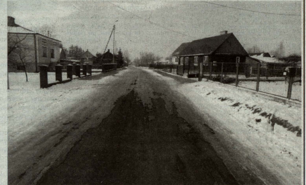
Nową nawierzchnię asfaltową otrzymała ul. Sielczyk z fragmentem ul. Langiewicza (dojazd do SP nr 7). Po obu stronach ulicy wykonano też chodniki z kostki brukowej. Zadanie zakończyło w listopadzie Przedsiębiorstwo Robót Drogowych SA.