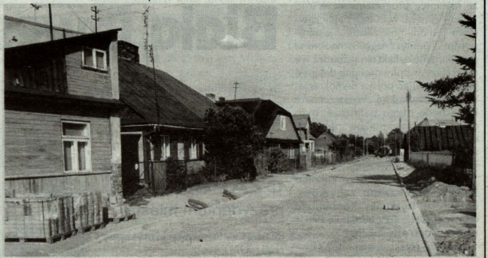
Przedsiębiorstwo Handlowo - Usługowe „Transbet” wykonało modernizację nawierzchni ul. Sitnickiej (na odcinku od ul. Janowskiej do ul. Grunwaldzkiej). Prace trwały od kwietnia do września. Po doprowadzeniu niezbędnych mediów wykonano nawierzchnię z kostki brukowej długości 430 m oraz chodniki po obu stronach jezdni. Przy wjeździe od ul. Piłsudskiego wykonany został parking na 11 pojazdów samochodowych. Koszt całej inwestycji ok. 540 tys. zł.