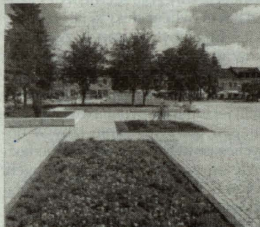
Prawie 10 miesięcy trwała gruntowna modernizacja Placu Wolności. Kostki granitowej dostarczyła firma Vikking, zaś wykonawcą była firma Steinbudex ze Świdnicy. Na Placu Wolności ułożono trwałą płaszczyznę z kostki o powierzchni 4810 mkw. Roślinność wraz z drzewami zajmuje powierzchnię 2.254 mkw, zaś klomby kwiatowe powierzchnię 75 mkw. Wartość inwestycji wyniosła ok. 2 mln zł.