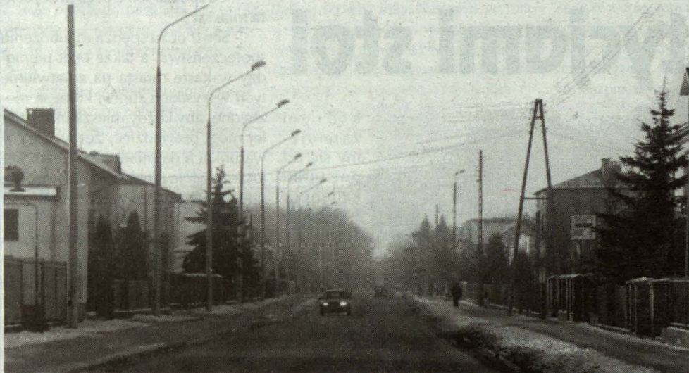
Spełniły się nadzieje mieszkańców ul. Kardynała Stefana Wyszyńskiego. Po wielu latach oczeki-wań podjęto się uporządkowania tonącej w błocie drogi. Przedsiębiorstwo Robót Drogowo- Mo-stowych położyło beton asfaltowy na jezdni długości 571 m. Wraz z nową nawierzchnią ulica otrzymała oświetlenie w postaci 23 słupów. Wcześniej udrożniona została istniejąca kanalizacja deszczowa i przebudowane wpusty uliczne. Wartość inwestycji 1.200 tys. zł.