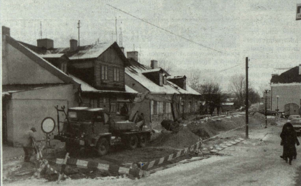
Trwa modernizacja ul. Jatkowej w centrum miasta. Inwestycja, której wykonawstwa podjęło się Przedsiębiorstwo Budownictwa Drogowego „Tre- DROM”, ma być zakończona w czerwcu 2002 r. Do tej pory zbudowano kanał deszczowy i odcinek wodociągu.