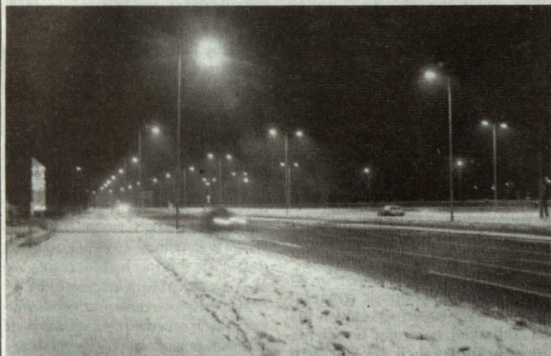
Oddana do użytku w roku ubiegłym zmodernizowana ul. Janowska otrzymała nowe oświetlenie. W czwartym kwartale br. wybudowano 957 m linii kablowej oraz ustawiono 23 słupy z sodowymi oprawami świetlnymi.