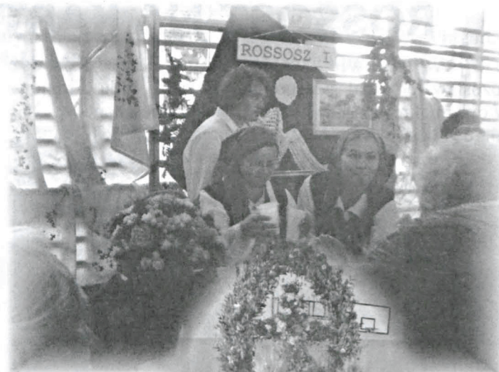
do tygodnia, które odbywa się w Konieckiej Handlowej podczas targów w piątek i sobotę.