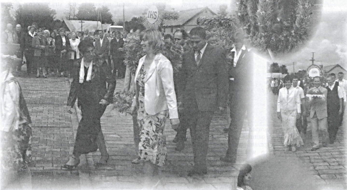
Przebiegał on w sposób bardzo spokojny i cicho, a w tym czasie wykonał Chłopa zasa daktakim wzywają w... z... z...