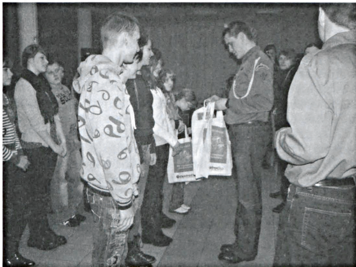
z Rossosza. Były to wyłącznie ciekawe i dobre doświadczenia.

Spotkanie w Białej Podlaskiej umożliwiło poznanie nowych osób i było bez wątpienia kolejnym doświadczeniem dla młodzieży. Także dla opiekunów, o czym miałam okazję przekonać się sama, towarzysząc w wyjeździe młodzieży