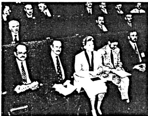
WALNE ZGROMADZENIE KIG - 8 wrzesień 1993 r.

WYDAWANE PRZEZ BIURO BIALSKOPODLASKIEJ IZBY GOSPODARCZEJ W BIAŁEJ PODLASKIEJ