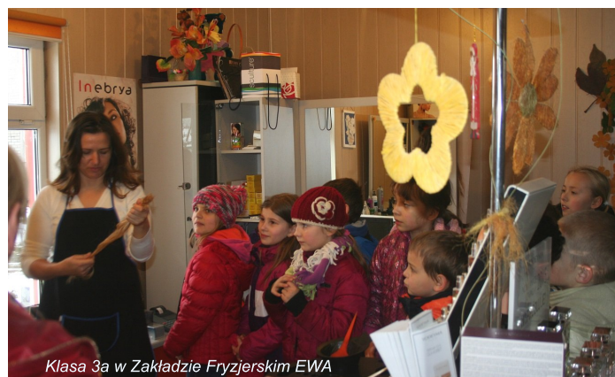
Klasa 3a w Zakładzie Fryzjerskim EWA