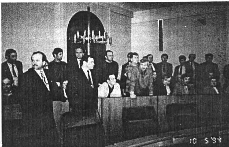
"Przymiarka" do senatorskich foteli?