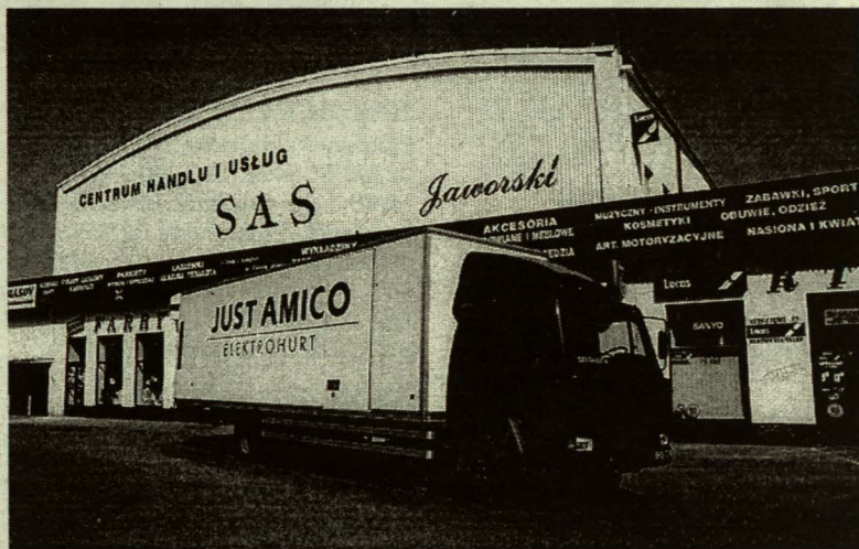
Just Amico to także Centrum Handlu i Usług