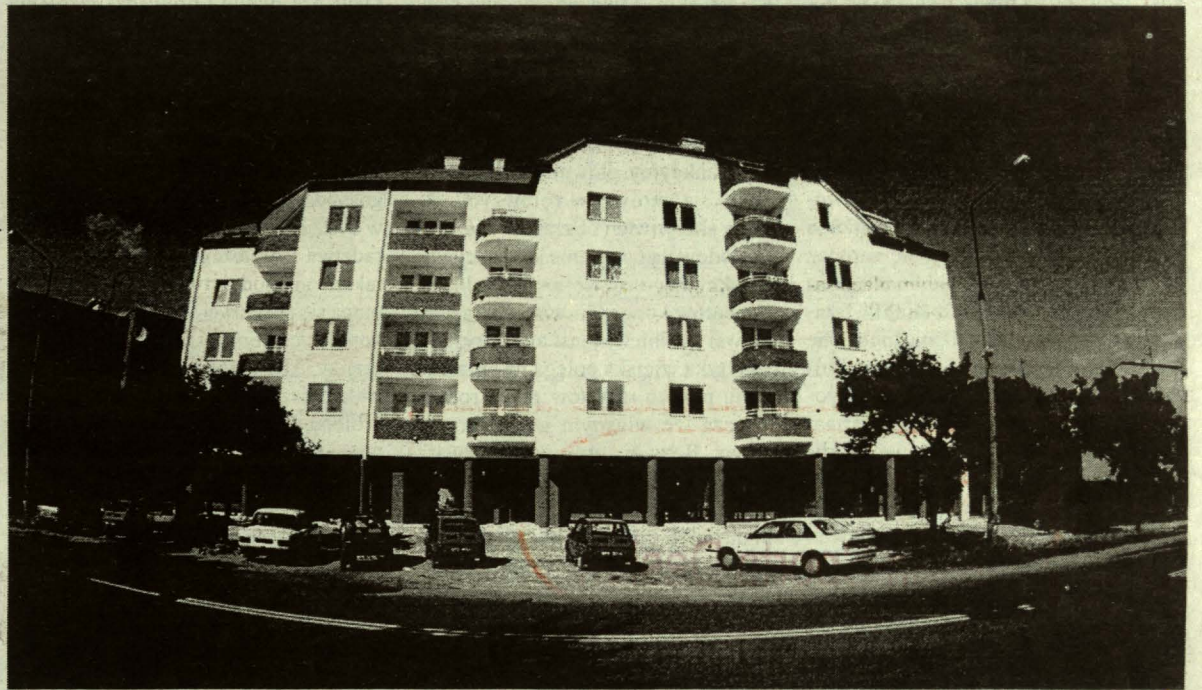
Ulica Zamkowa w Białej Podlaskiej