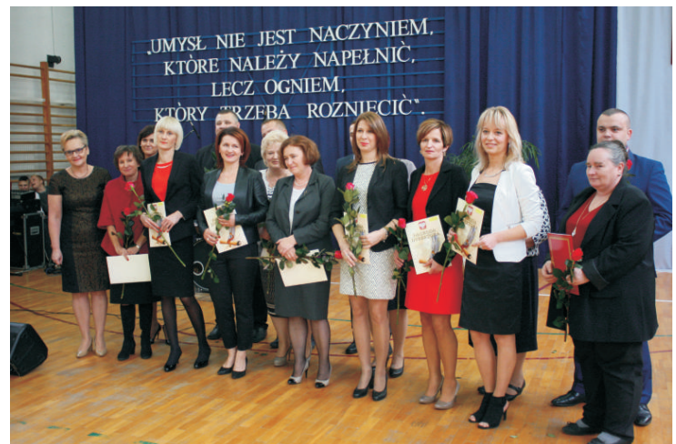
Zespołu Szkół im. Orła Białego w Kobylanach