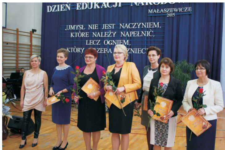
Szkoły Podstawowej im. J. U. Niemcewicza w Neplach