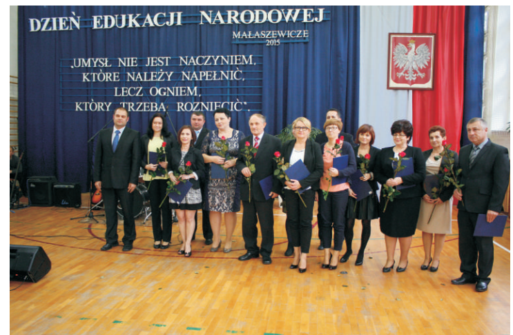
Zespół Szkół im. Władysława Stanisława Reymonta w Malaszewiczach